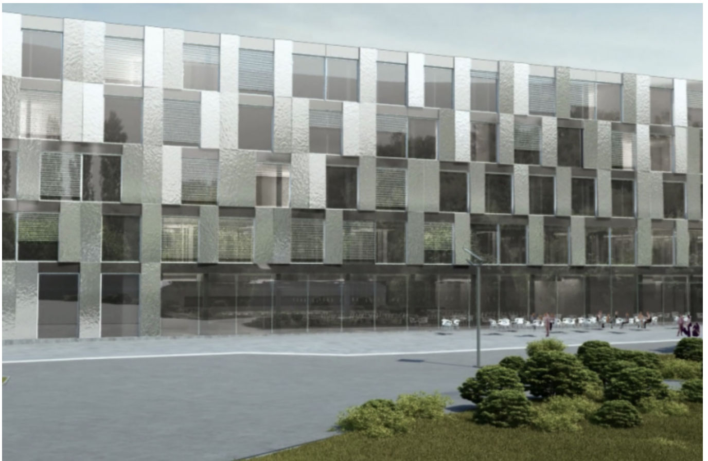
Корпус Géopolis. Фото: Bureau d'architecture Itten + Brechbühl © UNIL, 2009

Author: Заррина Салимова, Лозанна , 31.01.2025.