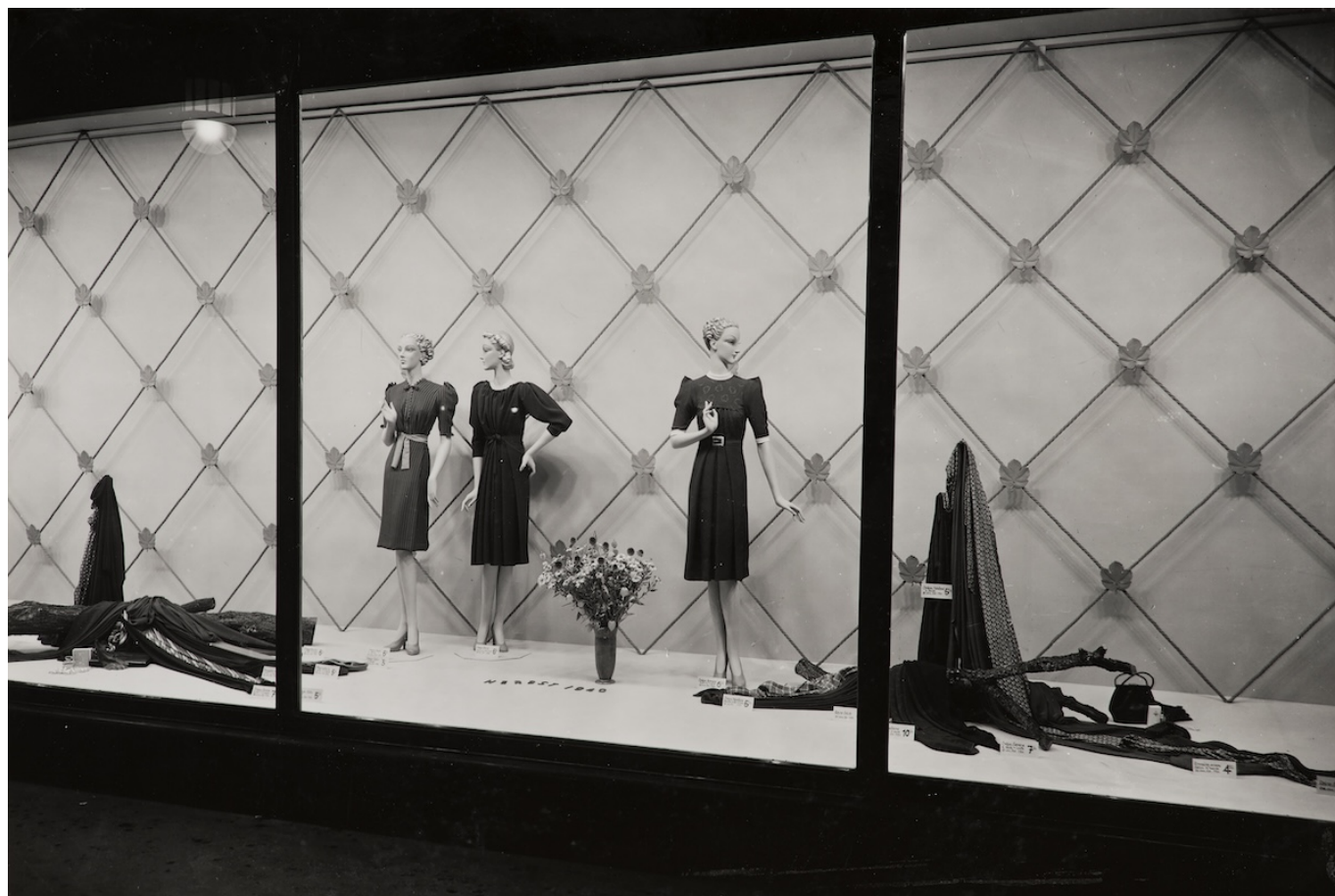
Витрина с новинками осенней моды 1940 года в бернском универмаге Loeb