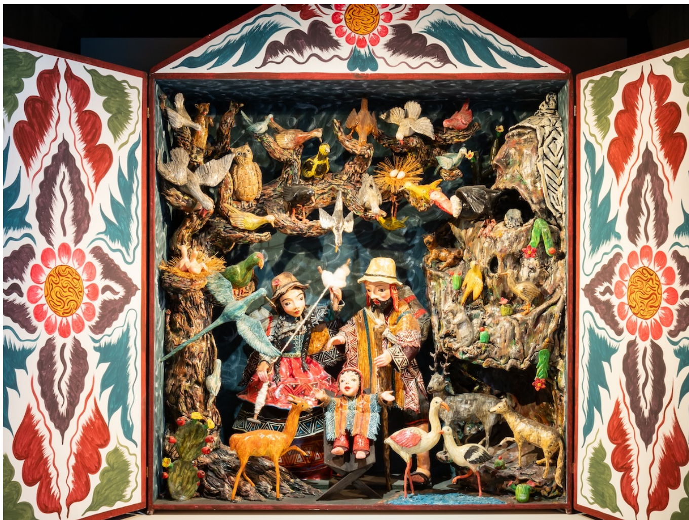
Перуанский вертеп.