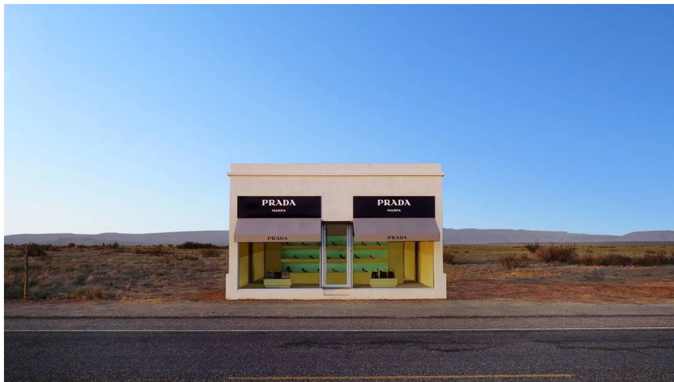
Elmgreen & Dragset, Prada Marfa, 2012. HD Video, Duration 8:00 min © 2024 ProLitteris, Zürich; Elmgreen & Dragset