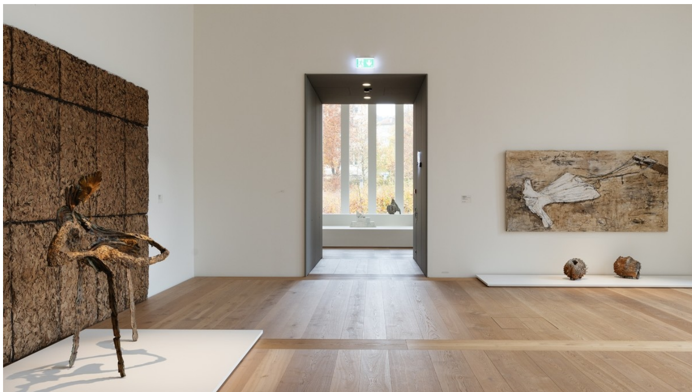
Богатство «бедного искусства» Kunsthaus Zürich, 2024. Giuseppe Penone: © 2024, ProLitteris, Zurich; Anselm Kiefer: © Anselm Kiefer; Shigeo Toya: © Shigeo Toya