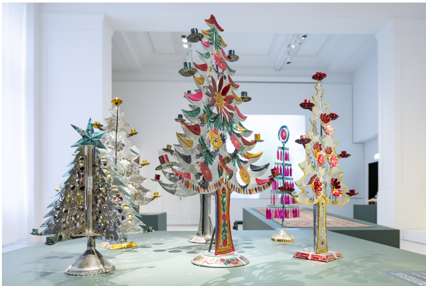
Ель и сосна издавна считались священными деревьями