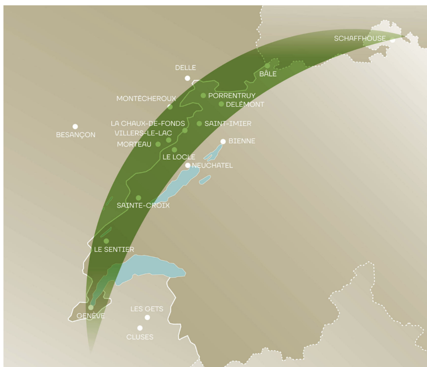
Та самая «Дуга часовщиков».

На границе между Швейцарией и Францией расположен регион, славящийся своими вековыми часовыми традициями, производством автоматов и музыкальных шкатулок. Речь идет о территории, называемой «Юрской дугой», «дугой часовщиков», «часовой аркой» или «страной часовщиков», т.е. о городских центрах механики и часового производства, расположенных от Женевы до Шаффхаузена и от Безансона до Биля/Бьенна. В 2020 году часовое искусство и механическое мастерство этого региона были внесены в список нематериального культурного наследия ЮНЕСКО, а четыре года спустя для сохранения и продвижения ноу-хау была создана франко-швейцарская ассоциация Arc Horloger.