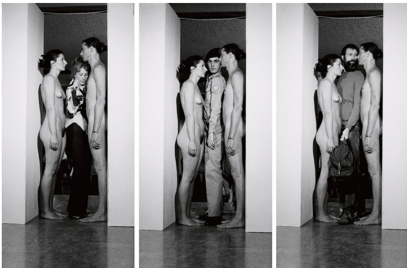
Ulay / Marina Abramović, Imponderabilia, 1977 Performance, 90', Galleria Comunale d'Arte Moderna, Bologna

реперформансы с участием 24 современных художников. Когда в ходе беседы в день открытия выставки модератор спросила Марину Абрамович о какой-то из ее работ сорокалетней давности, художница предложила поговорить о чем-то более интересном, например, о том, что ни один из ее перформансов 70-х годов невозможно повторить сегодня. Действительно, из-за политкорректности, новых правил безопасности, боязни «оскорбить» чьи-либо чувства и других всевозможных ограничений радикальные работы приходится адаптировать. И художница готова идти на здоровый компромисс. Так, во время первой демонстрации «Imponderabilia» в 1977 году в Болонье все другие входы в музей были заблокированы – публика была вынуждена протискиваться между двумя абсолютно голыми людьми, стоящими друг напротив друга. В Кунстхаусе же для посетителей, желающих избежать телесного контакта, предусмотрены еще два других входа. Помимо «Imponderabilia» в Цюрихе можно будет увидеть реперформансы «Luminosity», а также «Art is Beautiful».