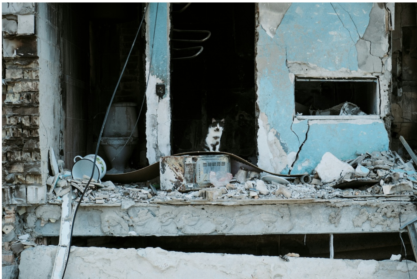
Руины дома в Бородянке.

Author: Заррина Салимова, Цюрих , 09.10.2024.