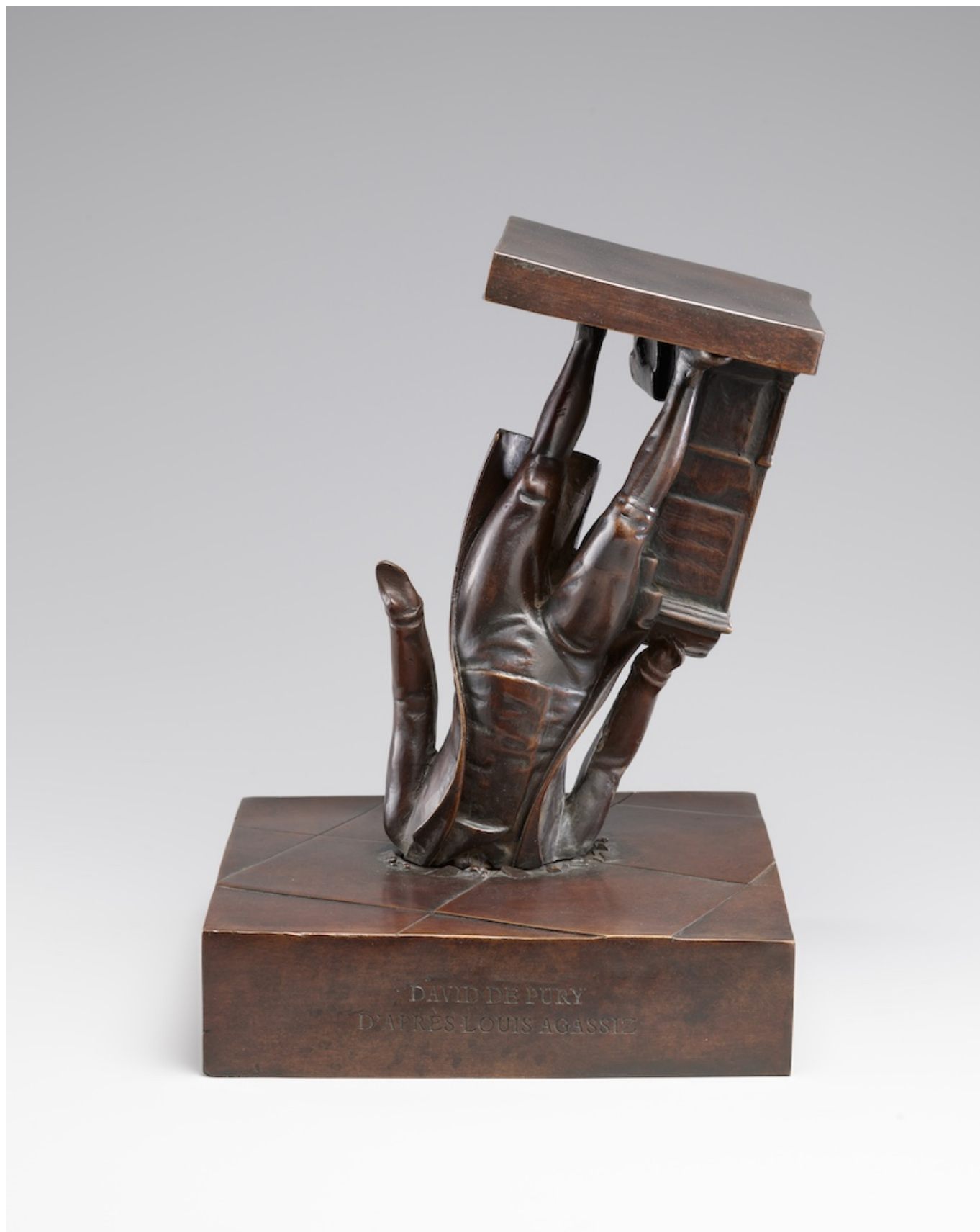
Матиас К. Пфунд, Великий в бетоне, 2022 г., бронза

Можно ли считать это цензурой истории? Посетителям предлагается обсудить этот вопрос и поделиться своим мнением о выставке.