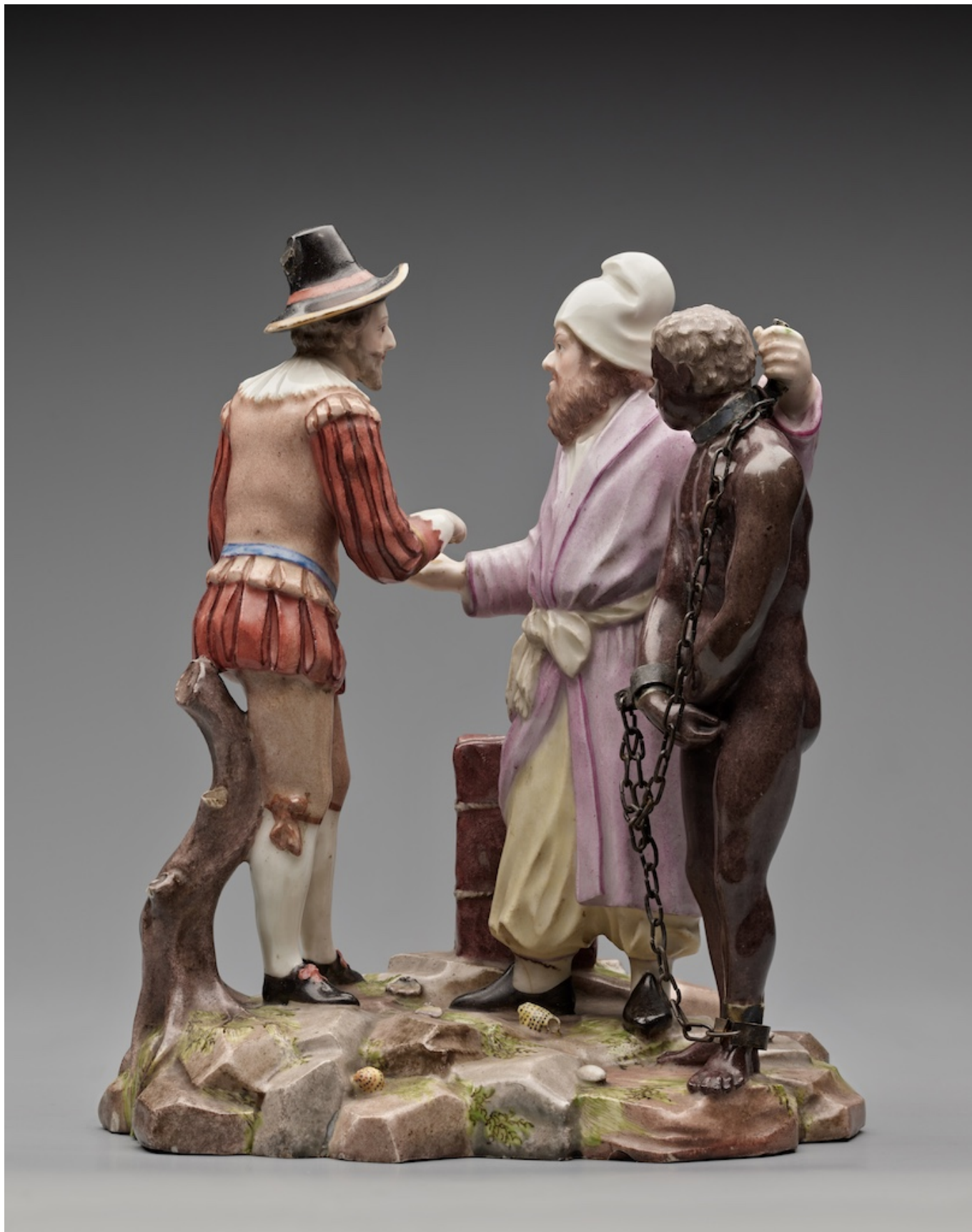
Торговля людьми, мануфактура Кильхберг-Шорен, Кильхберг, около 1775 года, расписной фарфор

Обратите внимание на «изделие из фарфора», изображающее сцену продажи человека, попавшего в рабство. Одежда фигур людей оставляет возможность для интерпретации: неясно, следует ли трактовать эту группу как выступающую за или против рабства. Известно, что владельцы и мастера фарфоровой фабрики