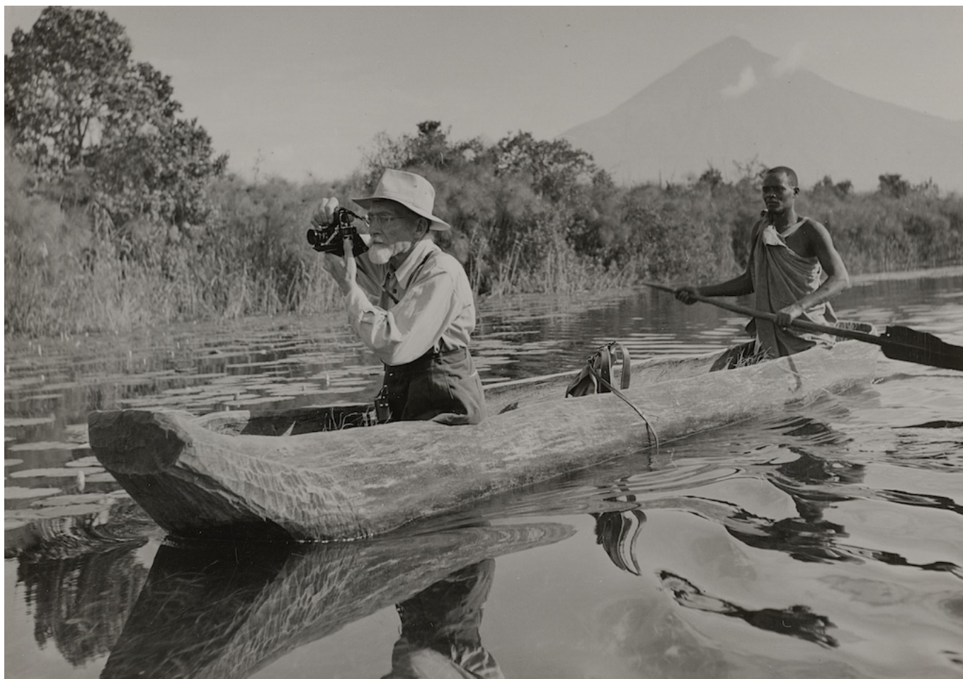
Экспедиция в Вирунга, озеро Мутанда (Уганда), 1954 г.