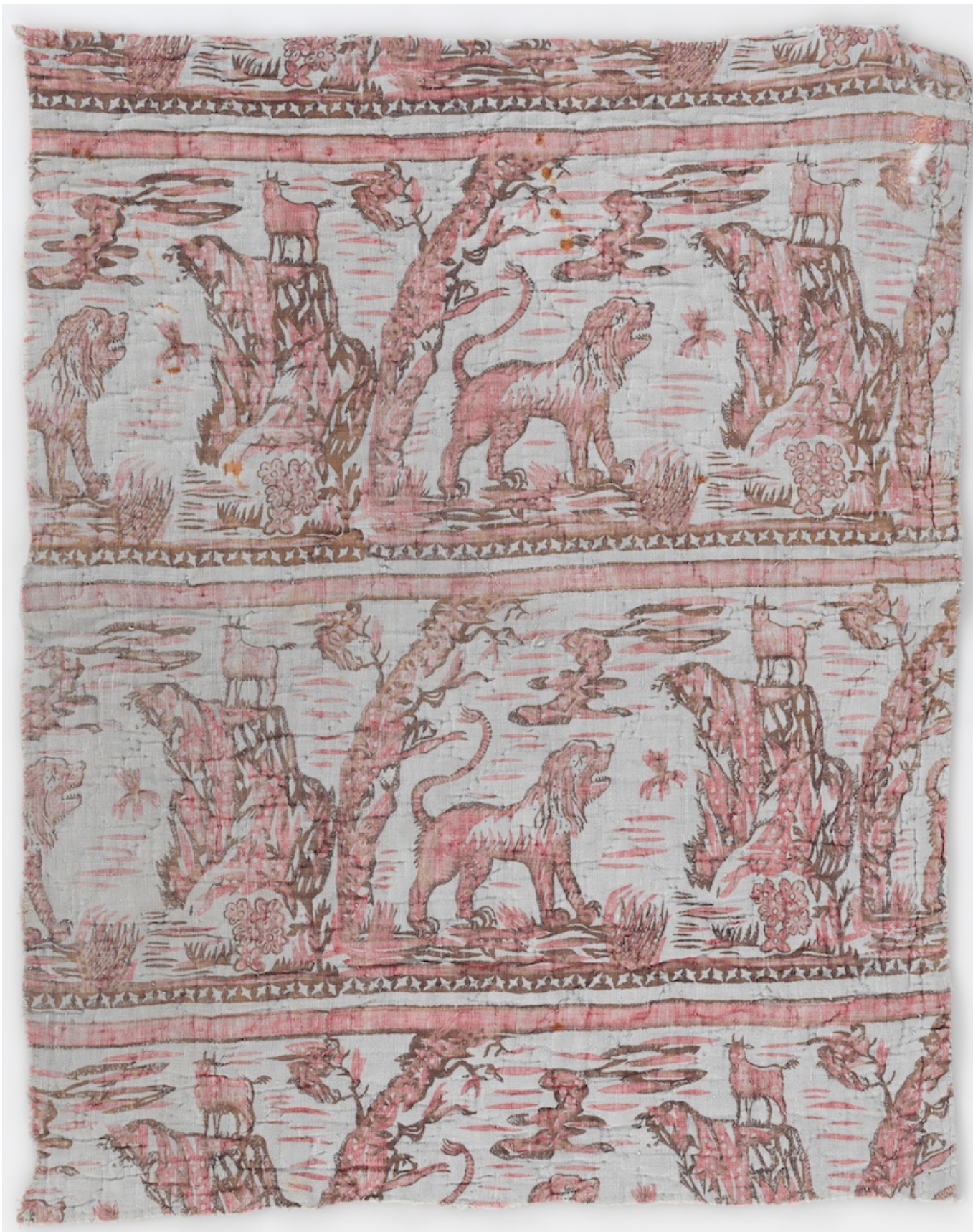
Лев и коза, мануфактура Petitpierre & Cie, Нант, около 1790 года, ксилография на хлопке

В те далекие времена швейцарцы – как мужчины, так и женщины – путешествовали по миру в качестве миссионеров или покидали родину, чтобы основать поселения и освоить территории, считавшиеся необитаемыми. Желавшие вырваться из нищеты или движимые жадной жаждой приключений, другие служили наемниками в европейских