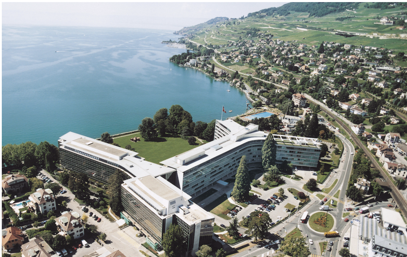
Штаб-квартира Nestlé в Ве́ве (с) Nestlé

Author: Заррина Салимова, Ве́ве-Эпиналь , 13.09.2024.