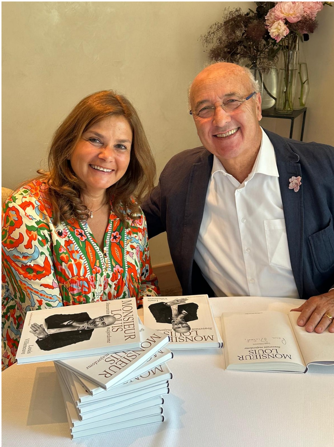
Un moment de gloire "par alliance" pour l'autrice de ses lignes

Source URL: https://nashagazeta.ch/blogpost/louis-villeneuve-maitre-enchanteur