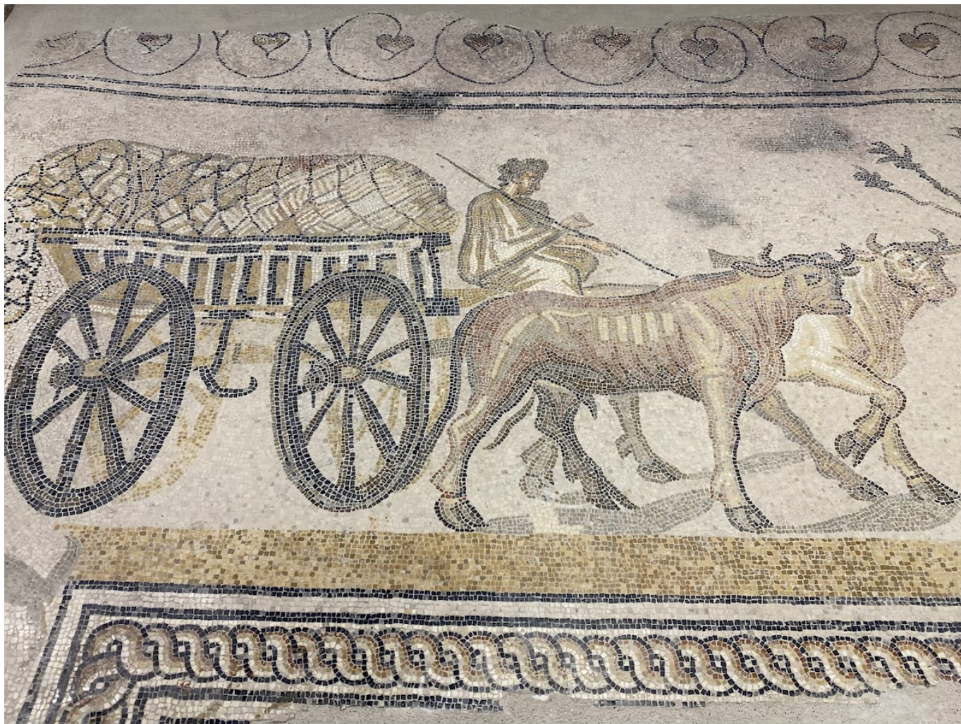
Мозаика «Деревенская процессия».

Author: Зарина Салимова, Орб , 31.05.2024.