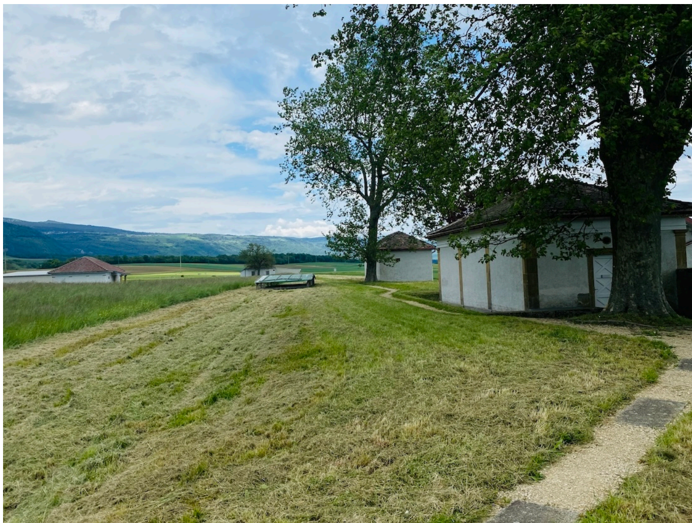
Павильоны с мозаикой на месте бывшей villa rustica.

Техника римской мозаики заключается в искусном сочетании цветов и размеров камней, которым придавали нужную форму с помощью специального молотка и клина. В качестве элементов мозаики использовались цветные камни, мрамор, керамика и стекло. Сначала делался эскиз, затем камни укладывались на основу из римского бетона, состоящего из извести, воды и песка, чтобы окончательно доработать рисунок. Иногда к настенной мозаике добавляли другие элементы, например, лепнину или ракушки.