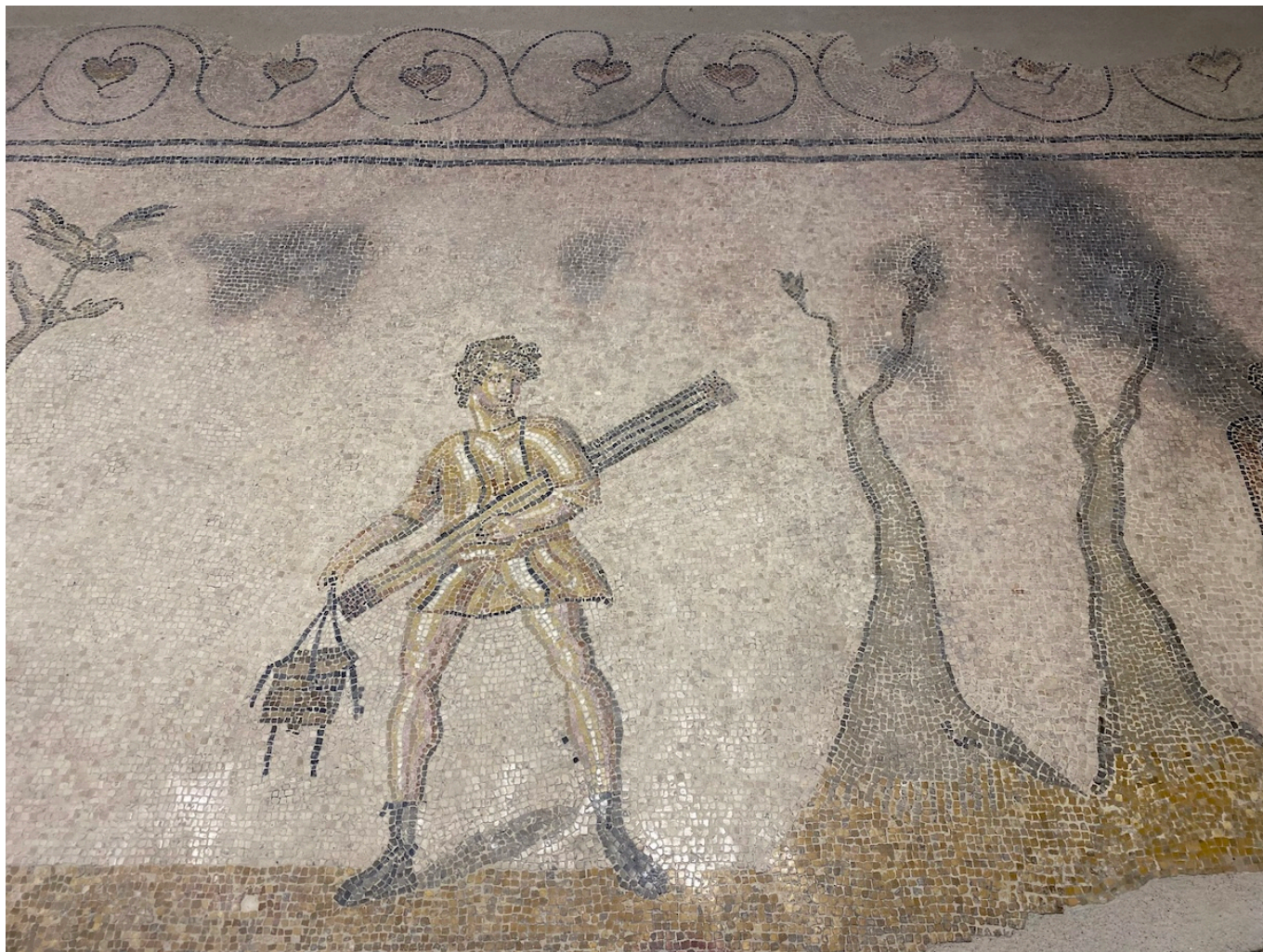
Часть мозаики «Деревенская процессия».

Одной же из самых красивых и лучше всего сохранившихся на территории комплекса считается мозаика, украшавшая комнату отдыха в термальном крыле. В шестиугольных медальонах представлены боги, в честь которых в римской культуре были названы дни недели: Луна (понедельник), Марс (вторник), Меркурий (среда), Юпитер (четверг), Венера (пятница), Сатурн (суббота), Сол (воскресенье). Изображены также различные мифологические фигуры, такие как Тритоны и Нереиды, Ганимед, Нарцисс. По углам расположены бюсты, обозначающие времена года, а по краю – сцены охоты с различными животными (собаками, лошадьми, кабанами, львами).