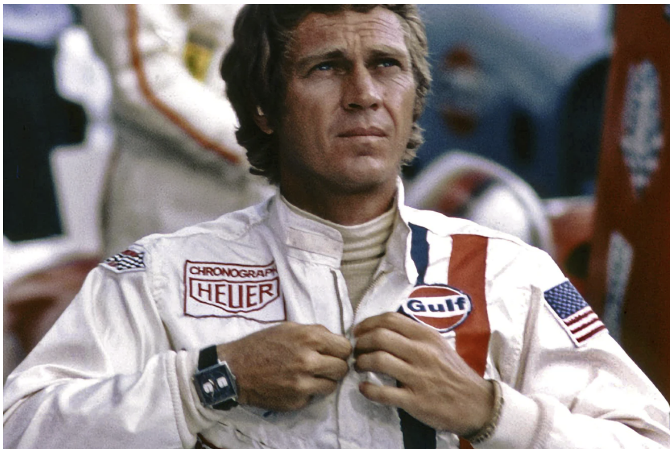
Кадр из фильма «Ле-Ман»

Author: Заррина Салимова, Берн , 30.05.2024.