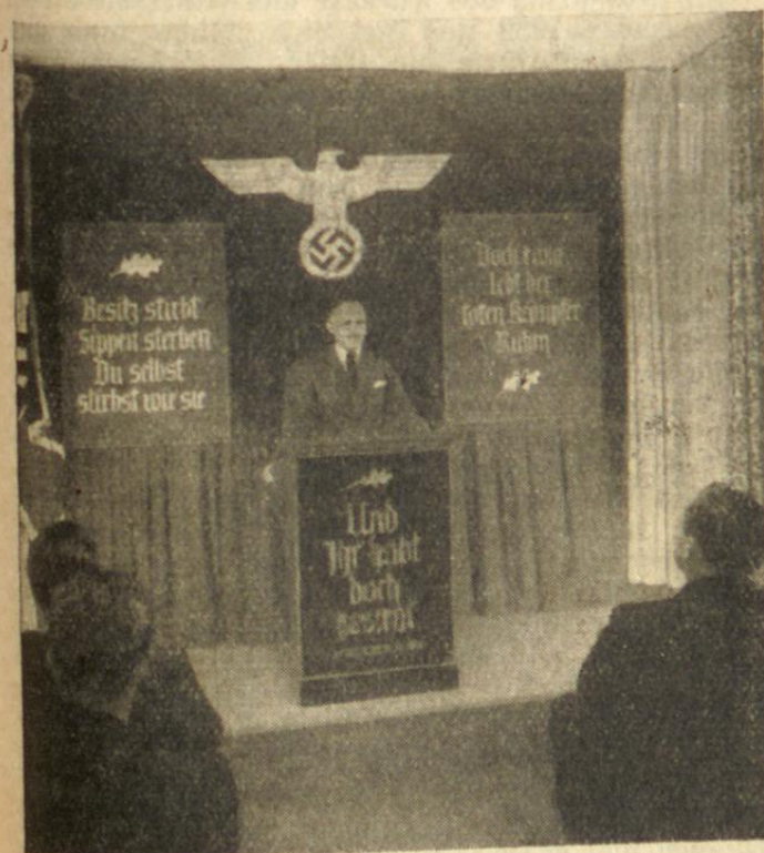
Chur: Pg. Ludwig spricht

Das Gelöbnis des Ortsgruppenleiters, an diesem Tage im Ringen um den letzten noch aus unserer Gemeinschaft stehenden Deutschen nicht zu scheitern, und ein begeistertes Sieg-Heil auf den Führer schlossen die Feier.