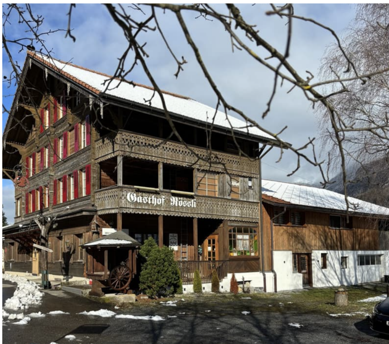
Отель Rössli.

Сюжет мог бы лечь в основу романов Сомерсета Моэма, Яна Флеминга или Джона Ле Карре. Место действия – старый отель Rössli в городке Унтербах в кантоне Берн. В 2018 году отель был приобретен за 800 000 франков молодым человеком Дэвидом В. и с тех пор управлялся им и его родителями. Все трое – родом из Китая.