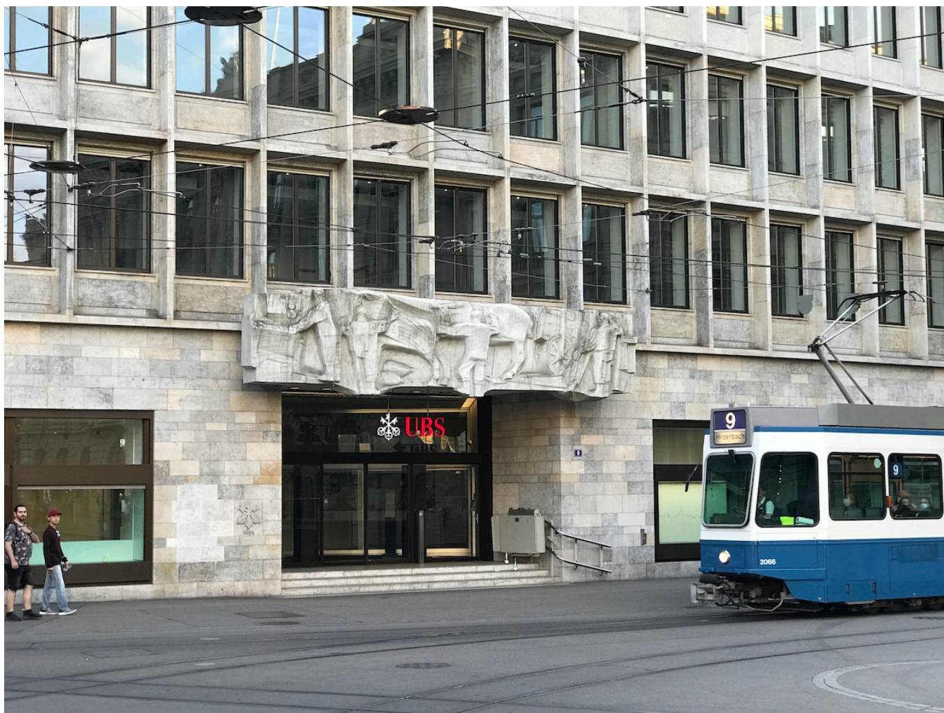
Штаб-квартира UBS на Парадеплац в Цюрихе.

Author: Заррина Салимова, Берн , 15.04.2024.