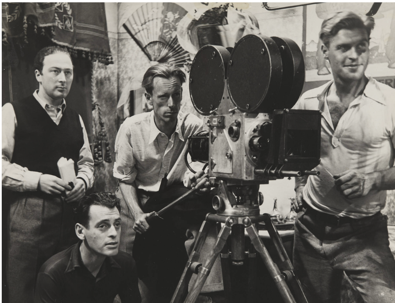
За камерой. Герман Халлер, Леопольд Линдтберг, Эмиль Берна, Франц Власак (слева направо). Egon Priesnitz. © Cinémathèque suisse

камерой, так и за ней, писали историю швейцарского кино – от сценария до режиссуры, от игры до монтажа и написания саундтрека. Рекомендуем всем, кого манит фабрика грез.