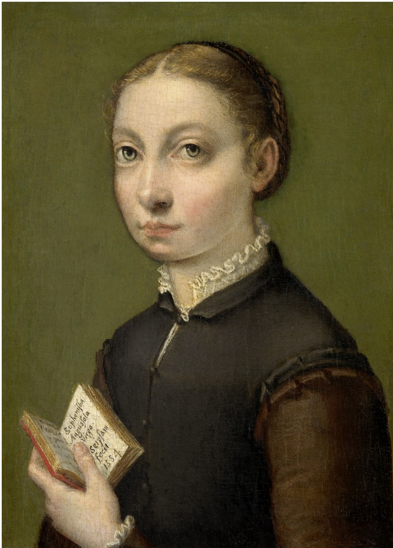
Софонисба Ангишоло. Автопортрет, 1554.