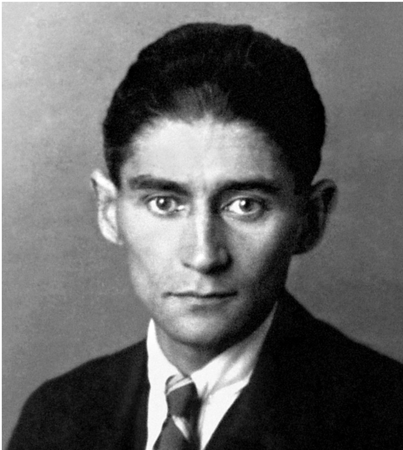
Франц Кафка.