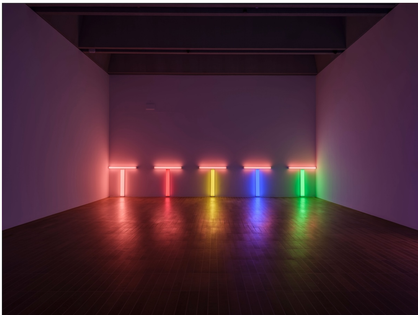
Untitled (to Don Judd, colorist) 1-5. Дэн Флавин, 1987 © Stephen Flavin / 2024, ProLitteris, Zurich

Американский художник Дэн Флавин (1933-1996) стал известен благодаря своим работам с промышленно изготовленными флуоресцентными лампами. Когда в 1963 году он закрепил на стене своей студии обычную лампу-трубку под углом 45 градусов и без лишних слов объявил ее искусством, – это был радикальный поступок. Тем самым он создал новую форму искусства и вошел в историю. Зрители сами становятся частью его инсталляций: залитое потоком света пространство превращается в иммерсивный художественный опыт, способный вызвать чувственные или даже духовные переживания. Выставка в Кунстмузеуме Базеля сосредоточена на работах, которые Флавин посвящал другим художникам или разным событиям. Рекомендуем любителям минимализма, а также тем, кто активно ведет социальные сети: фотографии световых инсталляций украсят любую ленту Instagram. Если у вас есть чувствительность к свету, то не забудьте взять с собой солнечные очки!