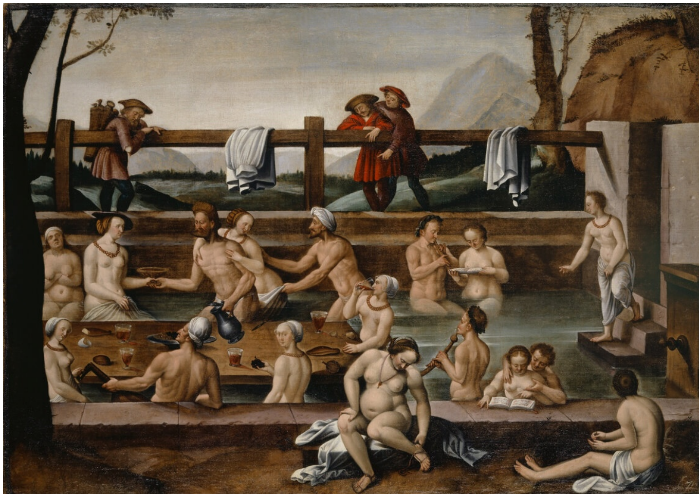
Купальни в Лёке (?), Ганс Бок Старший, около 1597 года. (с) Kunstmuseum Basel