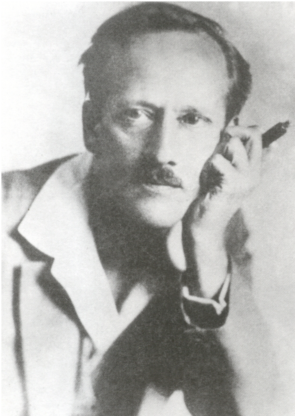
Mikhaïl Ossorguine (1878-1942)