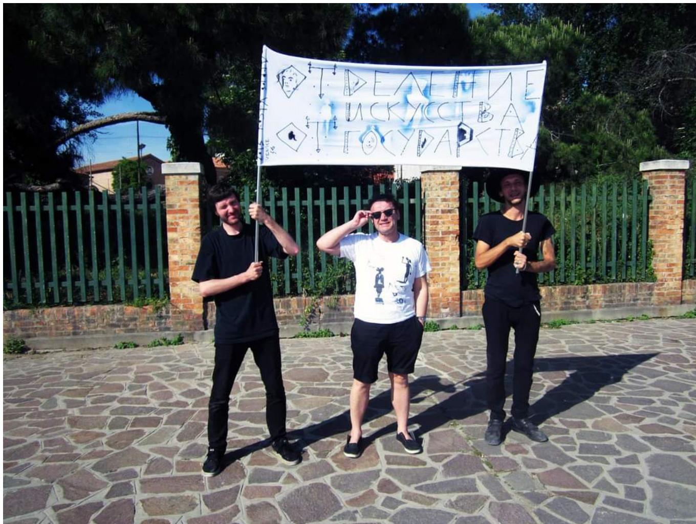
Акция в Венеции, 2015 г.