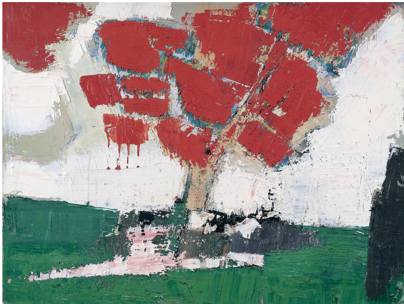
Николя де Сталь. Красное дерево, 1953 г. Collection particulière