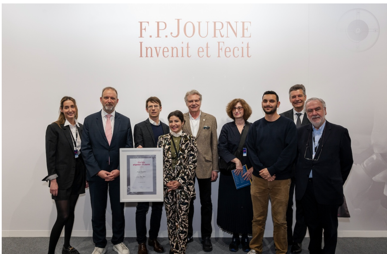
Вручение премии Solo artgenève - F.P.Journe