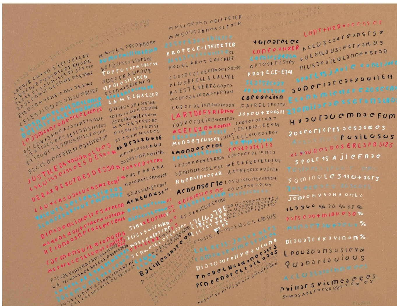
Работа Паскаля Вонлантена "6BenREgion"

Author: Заррина Салимова, Женева , 01.02.2024.