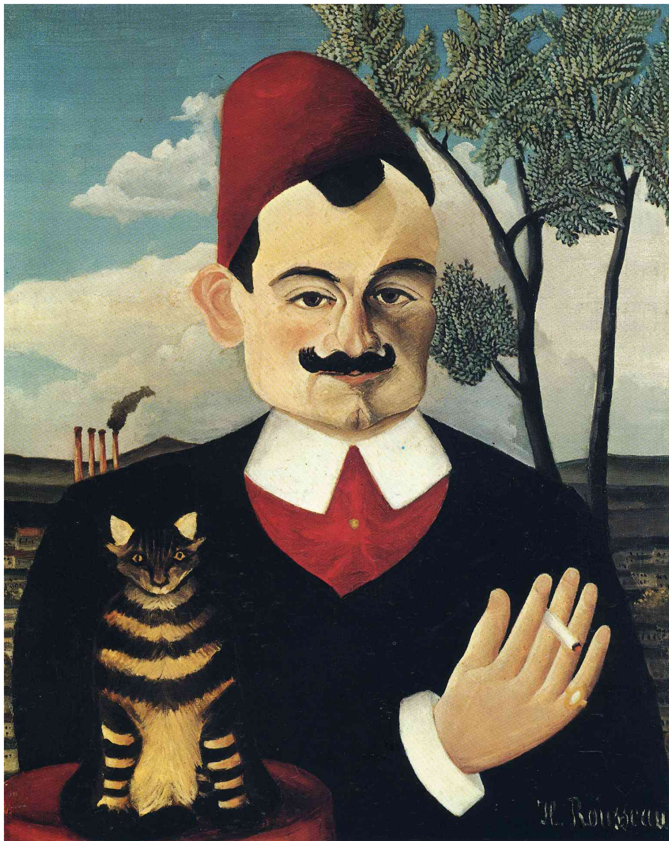
Анри Руссо. "Портрет Пьера Лоти", с 1941 года хранящийся в Кунстхаусе Цюриха

Что дальше? В соответствии с «Вашингтонскими принципами» 1998 года, которые подписала и Швейцария, должно быть найдено «справедливое решение», то есть определена некая денежная сумма, размер которой не будет разглашаться. «В отличие от конфискованного искусства, art en fite относится к произведениям, которые владелец смог продать в безопасной стране, например, в Швейцарии, из-за