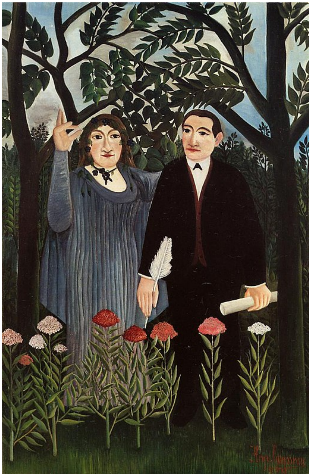
Анри Руссо. "Поэт и его муза", 1909 г.

Этьен Дюмон установил, что в центре разбирательства, тянувшегося с 2021 года, находится картина Анри Руссо «Поэт и его муза», на которой в 1909 году он изобразил поэта Гийома Аполлинера и его любовницу Мари Лоренсин. Украшение коллекции Художественного музея Базеля, это полотно было приобретено им в 1940 году, в Швейцарии, у графини Шарлотты фон Везделен. И вот сейчас наследница графини – так и видится «Пиковая дама», не правда ли? – хочет вернуть себе картину, оцениваемую сегодня в порядка пятидесяти миллионов швейцарских франков. Речь не идет о возвращении конфискованного нацистами произведения