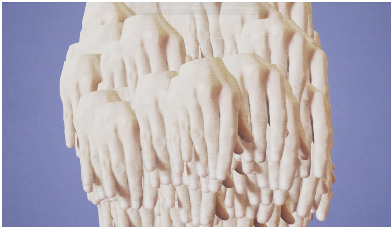
Кадр из фильма «Ur Heinous Habit»

Добавим, что с 23 по 28 января швейцарские пользователи смогут посмотреть ряд фестивальных фильмов в режиме онлайн. Просмотр одной картины стоит 8 франков, а пяти лент – 30 франков. Фестивальный абонемент, дающий доступ ко всем показам, запланированным в рамках Black Movie 2024 и Petit Black Movie 2024, за исключением киноконцерта En sortant de l'école , стоит 110 франков (или 120 франков, если вы хотите перечислить 10 франков на поддержку деятельности гуманитарного судна Ocean Viking, спасающего жизни мигрантов в Средиземном море). Не забывайте бронировать места на показ в кинотеатре даже при наличии абонемента!