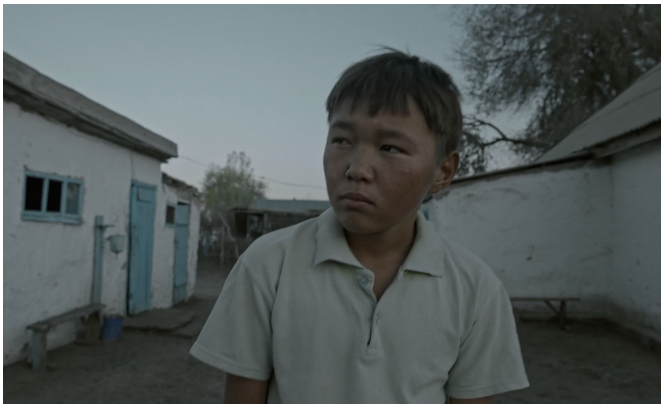
Кадр из фильма «Бауырына салу»

он сможет найти своих родителей. Однажды его бабушка умирает, и жизнь мальчика полностью меняется. Его мечта сбывается – но не совсем так, как надеялось его юное сердце. Этот трогательный фильм о взрослении предлагает взглянуть на вечный конфликт отцов и детей с точки зрения мальчика. 25, 26 и 27 января картина будет демонстрироваться в присутствии режиссера.