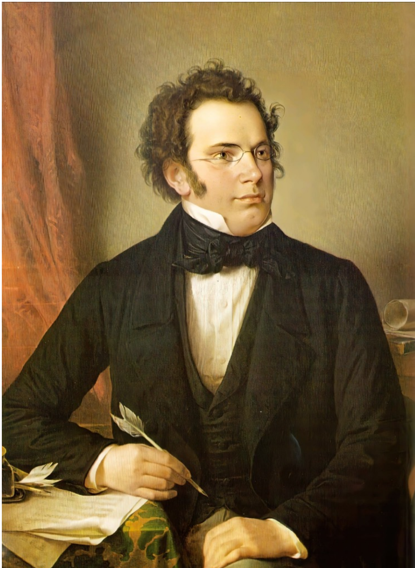
Франц Шуберт (1797-1828)