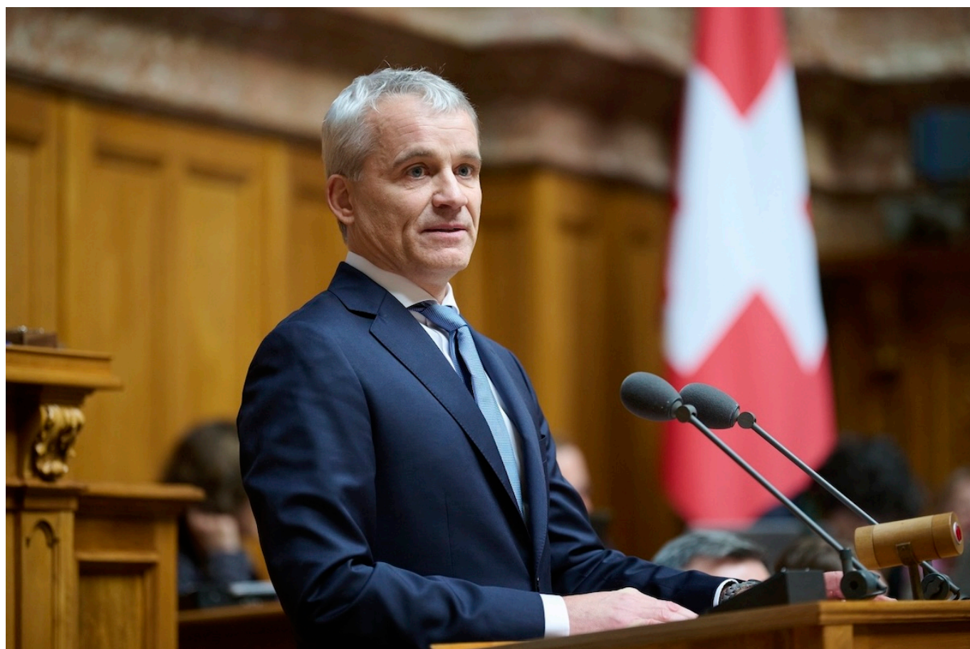
Беат Янс.