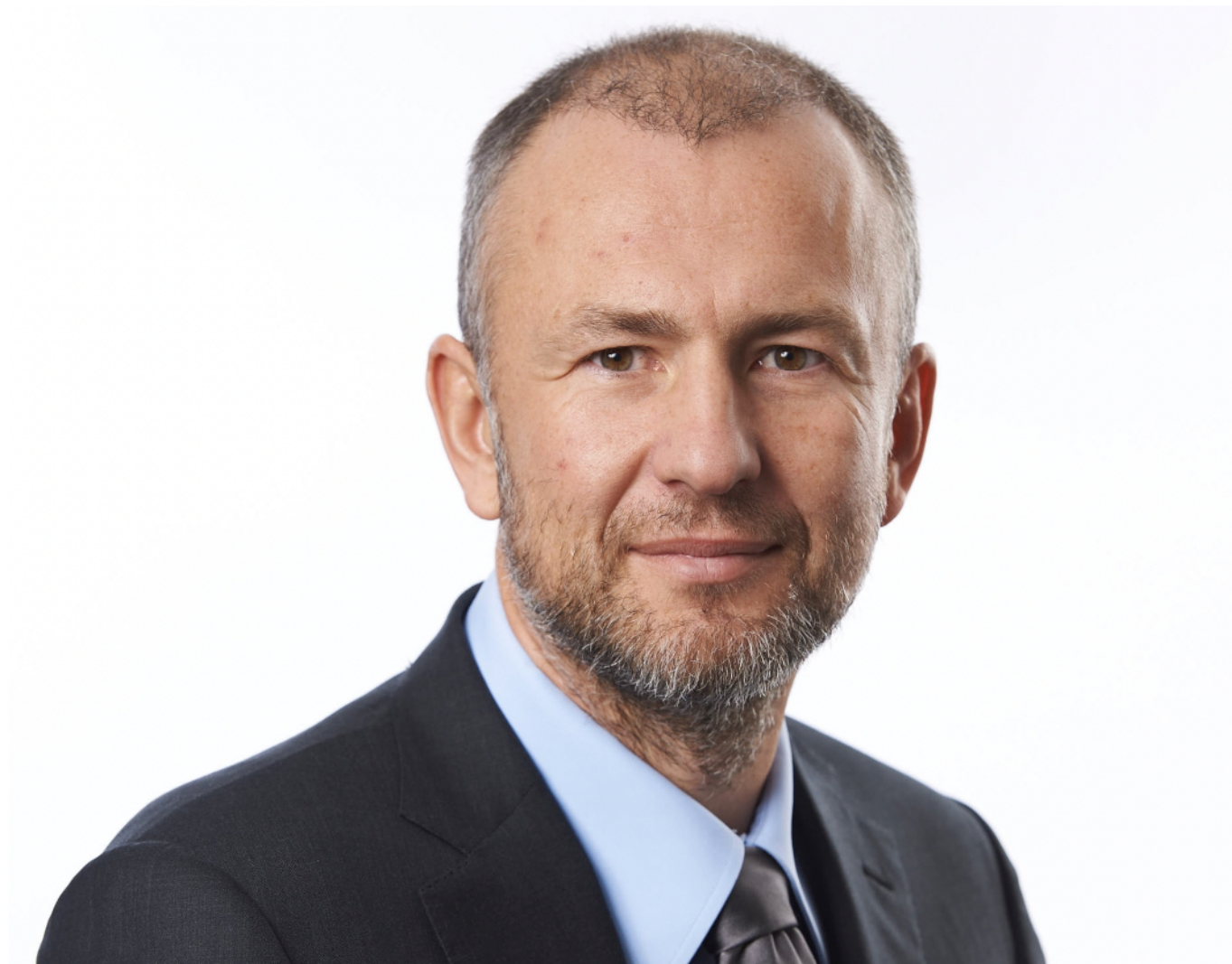
Андрей Мельниченко в 2017 году.

основанная им группа СУЭК, являющаяся одним из крупнейших в мире производителей угля, незаконно приобрела сибирскую компанию «СИБЭКО», хотя состоявшаяся в 2018 году сделка была одобрена властями. Прокуратура РФ хочет, чтобы государство вернуло себе «СИБЭКО». В деле фигурирует лично Андрей Мельниченко. «Эти проблемы могут быть вызваны его позицией по войне в Украине, которая отличается от официальной версии», - пишет Bilan.