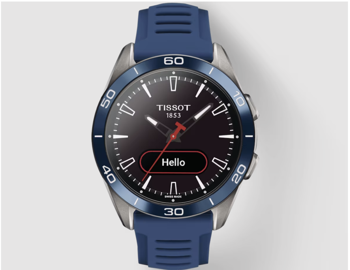
Tissot T-Touch Connect Sport

Производство в Ла-Шо-де-Фоне занимает площадь около 1 200 м 2 . Инженеры, физики, техники, наладчики, операторы – было создано около 25 рабочих мест. «Это первое место в Швейцарии по производству солнечных циферблатов для часов. Все наши конкуренты используют циферблаты азиатского производства, качество которых гораздо ниже», - отметил в комментарии Le Temps глава Tissot Сильвэн Долла.