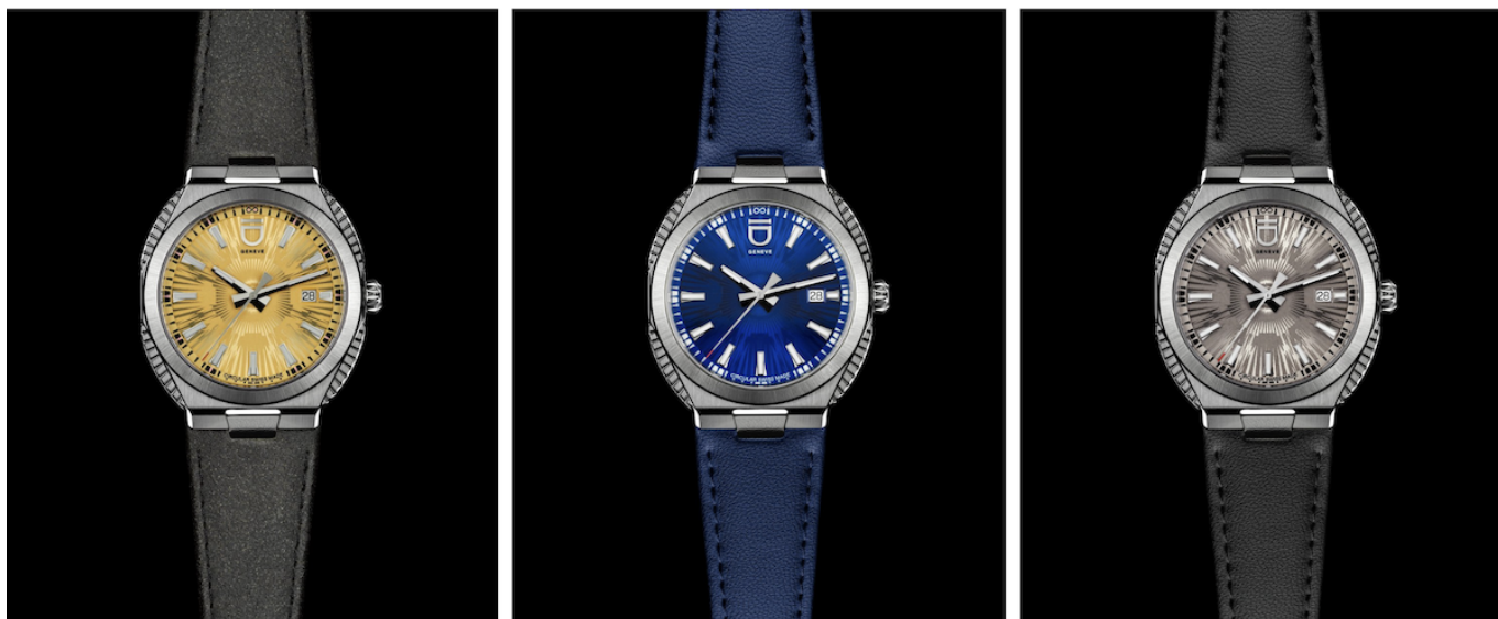
Часы из коллекции ID Genève Circular S Sun.

Основанному в 2020 году стартапу ID Genève есть чем гордиться: в рамках недавнего раунда по сбору средств ему удалось собрать два миллиона франков от группы из четырех инвесторов, одним из которых стал Леонардо Ди Каприо. Сколько именно он вложил, неизвестно, но даже один франк его инвестиций уже окупился резонансом, который вызвала эта новость. Чем же молодой женеvский часовой бренд привлек известного актера и обладателя премии «Оскар»?