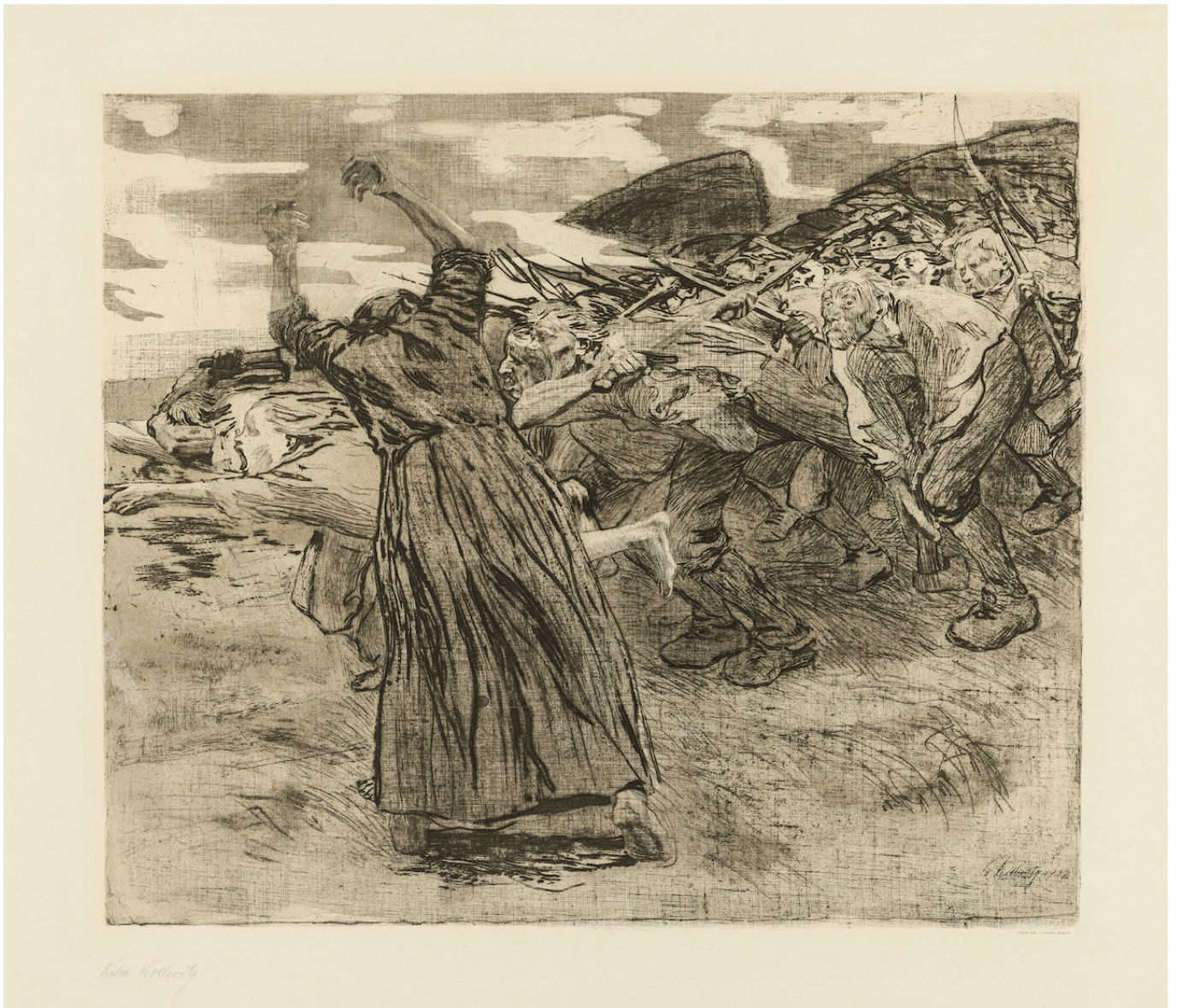
Кете Кольвиц. Крестьянская война, 1902-1903 г.

Парная выставка Кольвиц-Хатум проходит в залах, предназначенных для временных экспозиций, однако она прежде всего находится в диалоге с закрытыми в данный момент помещениями, где обычно выставляются произведения из коллекции цюрихского промышленника Эмиля Георга Бюрле, о которой Наша Газета не раз рассказывала . После серии разоблачительных публикаций и взлома хакерами куар-кодов с описаниями произведений, руководство музея приняло наконец решение о пересмотре концепции экспонирования и, главное, описания коллекции Бюрле, имеющей более чем спорное происхождение. Так что до ноября основные залы второго этажа здания на Heimplatz закрыты на переразвеску. Более того, в анонсах на сайте музея уже появилась информация, что в новой развеске внимание будет уделено не только самой уникальной коллекции Бюрле, но и тому контексту, в котором она формировалась, в частности войне и вооруженным конфликтам. Пока же за эти темы «отвечает» прекрасно задуманная, умная и лаконичная выставка Кете Кольвиц и Моны Хатум, двух важнейших художниц двадцатого столетия.