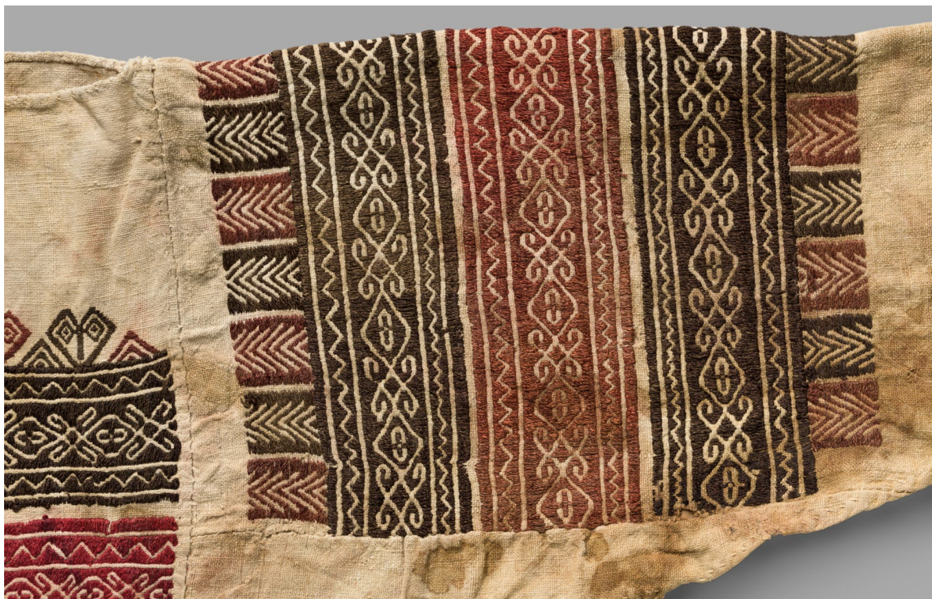
Фрагмент вышивки.

древнеперсидские ткани, среднеазиатские шелковые кафтаны и бархат с золотым шитьем, фонд ежегодно проводит небольшие, но познавательные выставки. Так, в этом году посетители смогут увидеть экспонаты из Национального музея Бейрута, которые в течение нескольких лет реставрировались в фонде и после временной выставки отправятся обратно. Речь идет о редчайших одеяниях, найденных в 1988-1993 годах в захоронении в скальной пещере Асси эль-Хадат в горах Ливана. Благодаря сухому климату текстиль XIII века сохранился до наших дней. Эта одежда принадлежала маронитам – раннехристианской общине, проживавшей в Ливане и Сирии, подвергавшейся гонениям мамлюков и нашедшей убежище в Ливанских горах. «Последние одеяния» часто не изготавливались специально для погребения, а носились еще при жизни в качестве повседневной или праздничной одежды. Многочисленные заплатки и следы починки свидетельствуют о бережном и рациональном обращении с текстилем, производство которого в то время было трудоемким и дорогим. Перед поездкой в Риггисберг непременно забронируйте экскурсию и по расположенной рядом с музеем вилле, где жила чета Абегг. Каждая комната этого элегантного и напоминающего шкатулку с драгоценностями здания оформлена в соответствии с изысканным вкусом супругов, посвятивших жизнь изучению и коллекционированию предметов искусства.