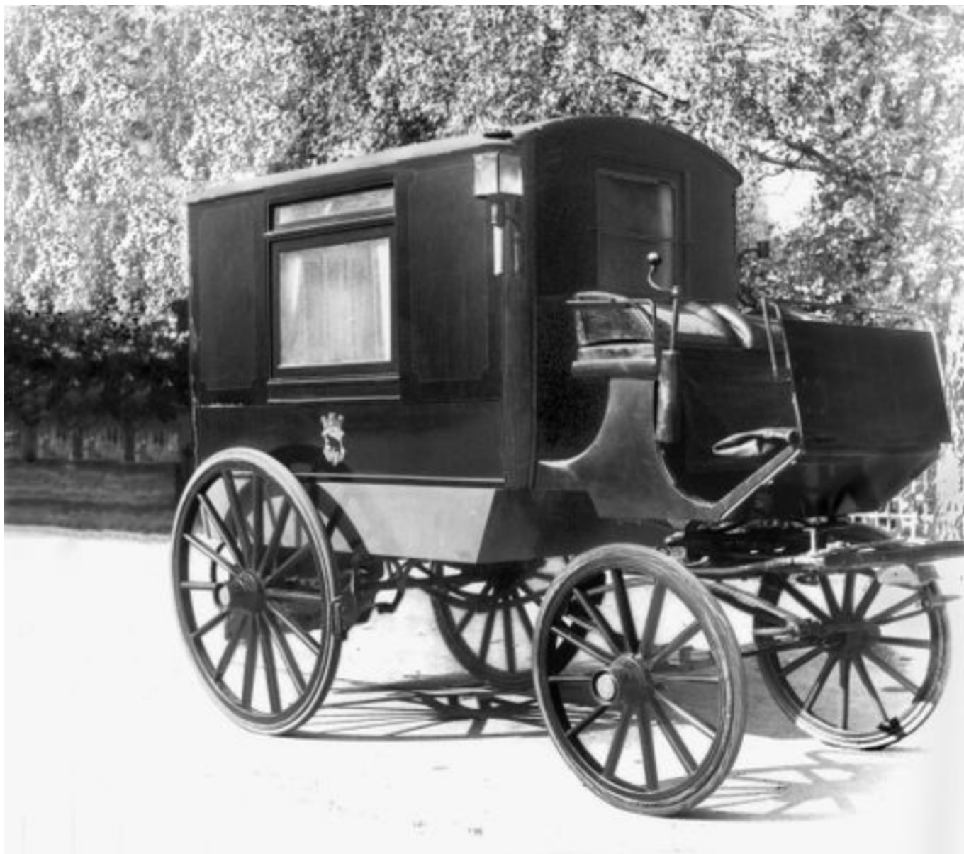
Бернская карета (в буквальном смысле) скорой помощи, ок. 1890.

общения во всех его проявлениях. Зачем мы вообще общаемся? И с кем? Что нужно для того, чтобы понять друг друга? Ответы на эти вопросы вы найдете на выставке, выстроенной в игровой и доступной для детей форме. Узнать о развитии стрелкового спорта и попробовать свои силы в стрельбе из пневматической винтовки 1952 года можно будет в Музее стрелков . Ребятам же, которые не расстанутся с игрушечной аптечкой, наверняка понравится медицинская коллекция бернского госпиталя Inselspital , которую можно будет увидеть 19 и 26 августа. Аппараты искусственной вентиляции легких, флюороскопы, искусственные тазобедренные суставы, пилы для ампутации: собрание насчитывает более 10 000 мелких и крупных предметов, отражающих историю медицины и здравоохранения за последние 200 лет.