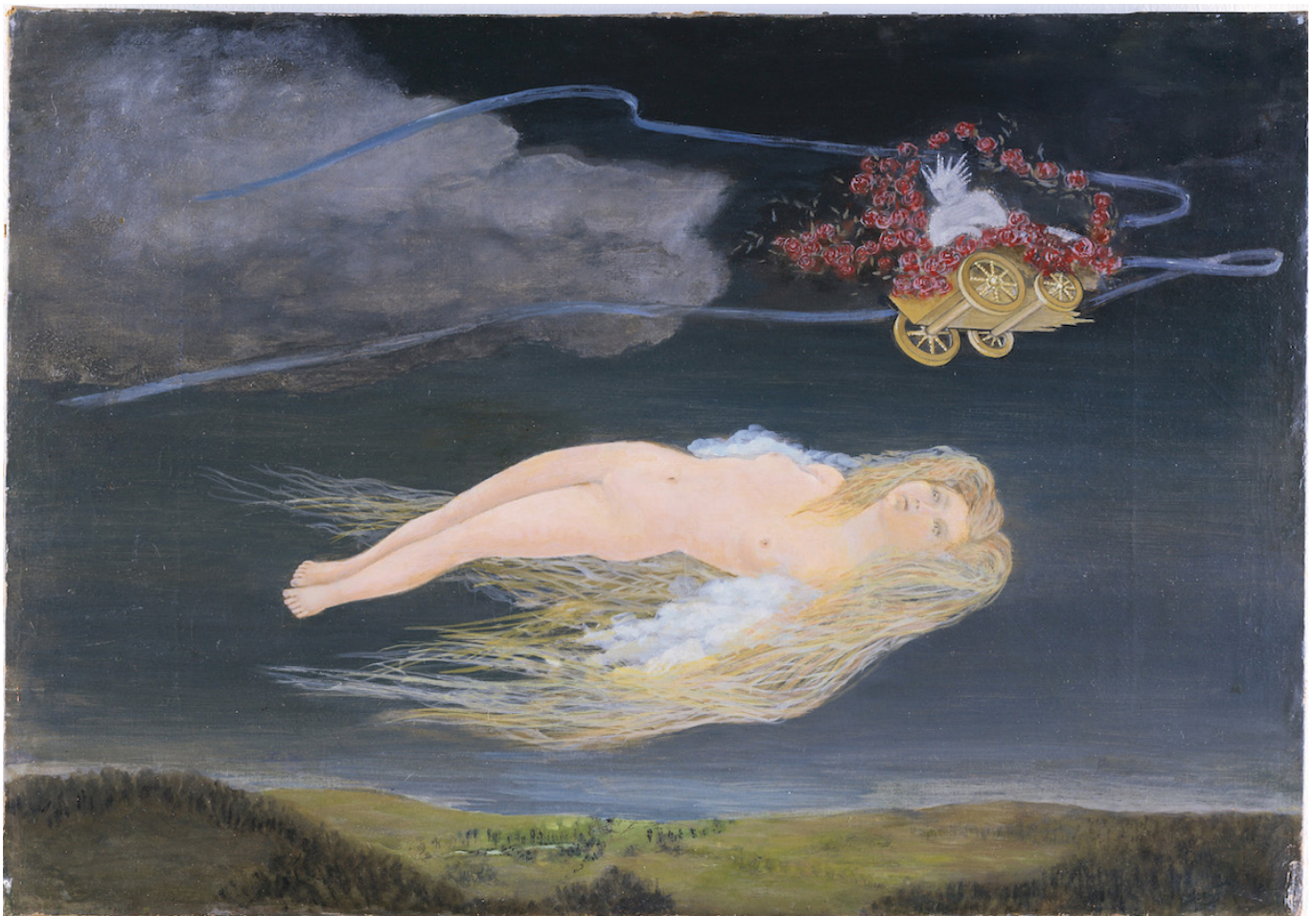
Мерет Оппенгейм. Страдания Геновевы. Kunstmuseum Bern.