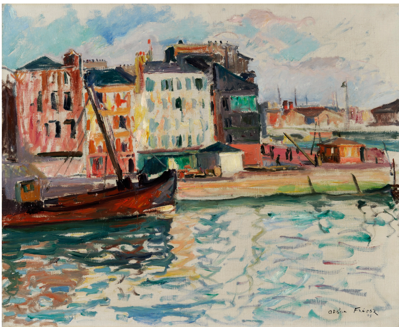
Эмиль Отон Фриез. Порт в Онфлёре, 1905 г. Collection privée © Dr.

Author: Надежда Сикорская, , 07.07.2023.