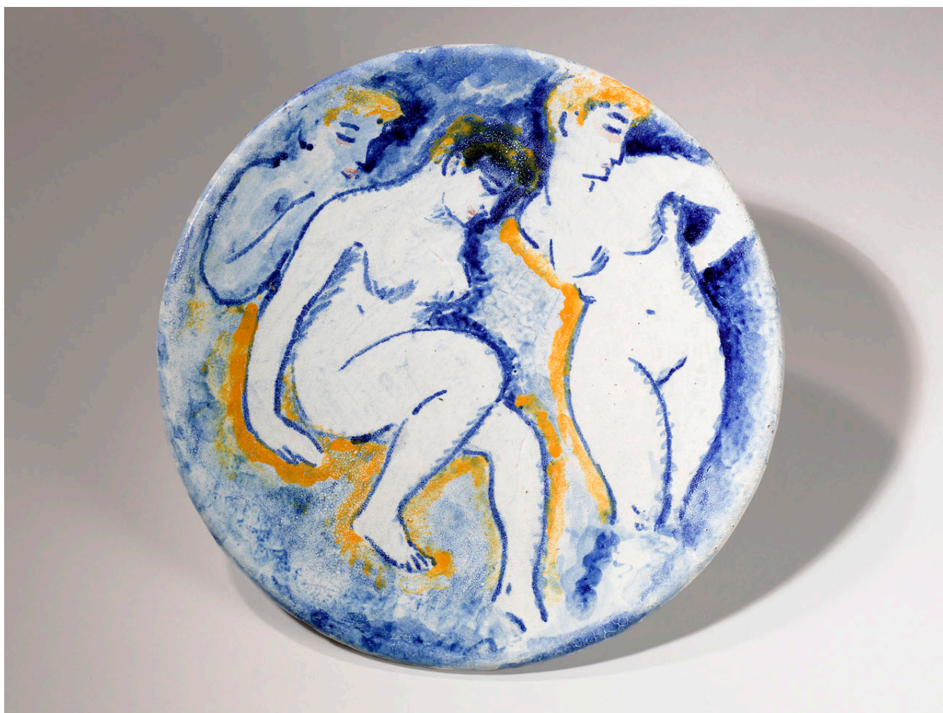
Кис Ван Донген. Тарелка, ок. 1907-1909 гг. Paris Musées/ Musée d'Art moderne de Paris

Излюбленными сюжетами фовистов были берега Сены и деревушки Шату: Пек, Аржатёй, уголки Нормандии, ночной мир с его кабаре и цирками, проститутками и канатоходцами, «девочками» и пьяницами, а также обнаженные натуры и портреты.