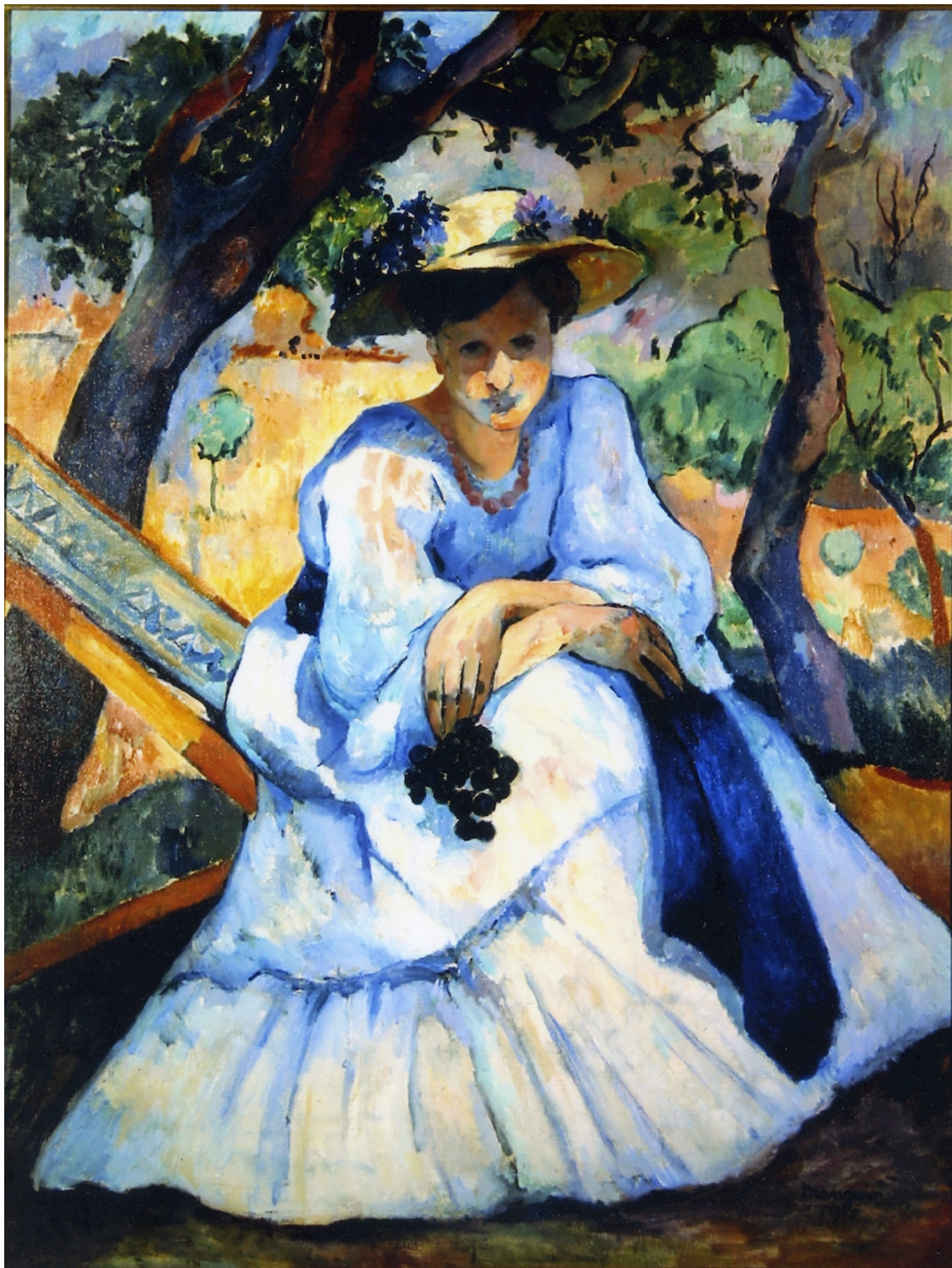
Анри Манген. Женщина с гроздьё, 1905 г.

Ядро группы фовистов составляли, помимо Матисса, Андре Дерен, Анри Манген, Морис де Вламинк, Шарль Камуан, Жорж Руо и Альбер Марке. Чаще всего они