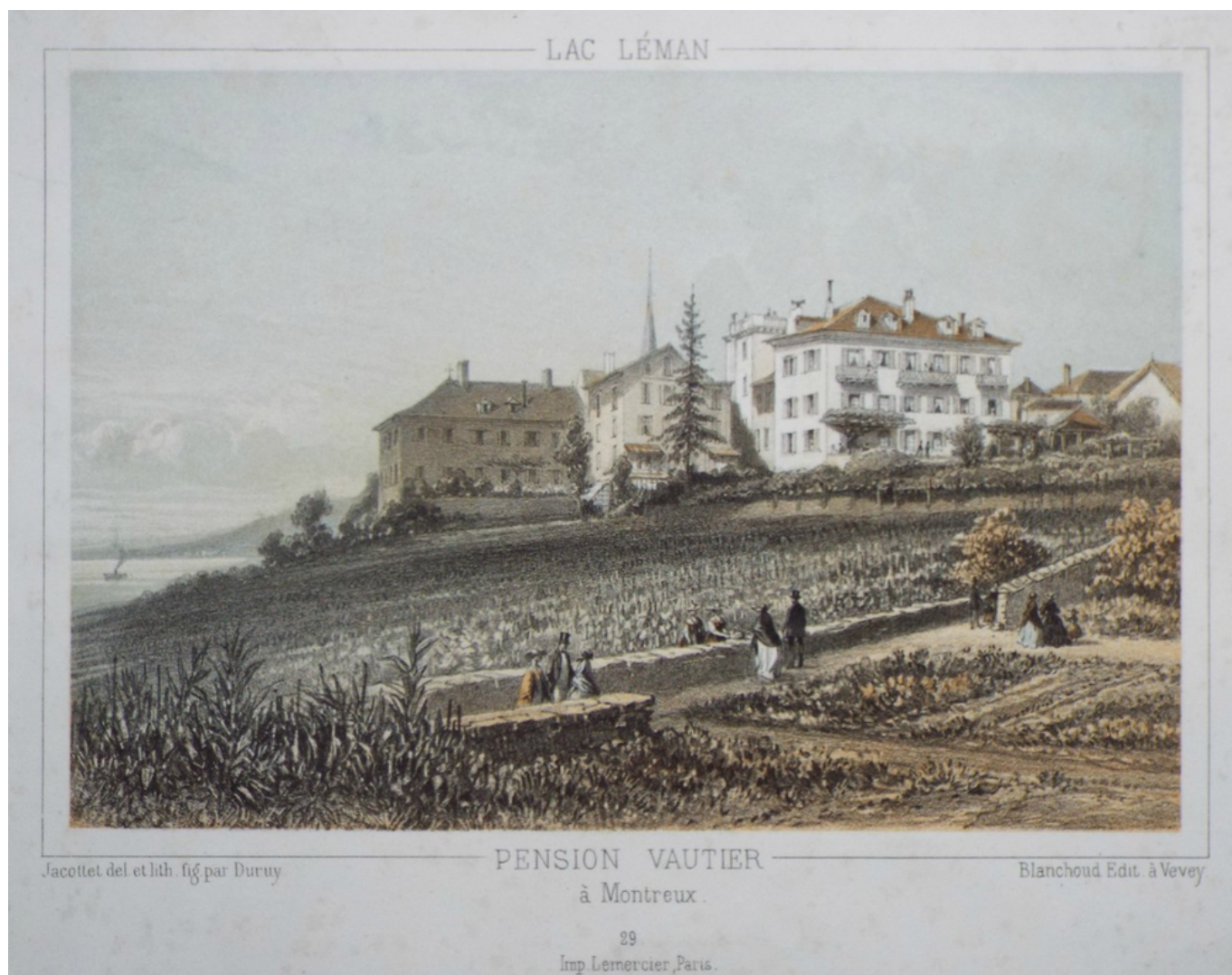
Пансион «Вотье» (Vautier) в Монтре, где останавливался Альфонс Доде. Литография XIX века

Осталось объяснить, зачем Террите связали с крохотной горной деревушкой Глион, находящейся на высоте 700 метров над уровнем моря. Начнем с того, что из Глиона открывается прекрасный вид на ту часть Женевского озера, где расположен Шильонский замок. Первую виллу в стиле шале здесь построил для себя в 1854 году женевский банкир Жак Мирабо, банк имени которого продолжает действовать и сегодня. Десять лет спустя рядом построили достаточно импозантное здание отеля Righi Vaudois, а в 1869 году открыл двери роскошный по тем временам отель Victoira. Его интерьер был выполнен в стиле Belle Époque и украшен уникальными предметами из коллекции владельцев. Но особенно престижным Глион стал после того, как в 1874 здесь поселился и прожил вплоть до своей смерти в 1890 году основатель компании Nestlé Анри (Генрих) Нестле.