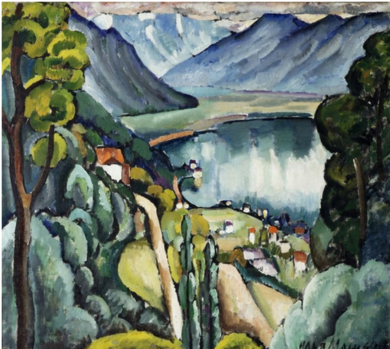
И.И. Машков. Женевское озеро. Глион, 1914 г. Государственная Третьяковская галерея.

Джакометти, Чарли Чаплин, Жорж Сименон, Коко Шанель. В сентябре 1976 года, почти за год до кончины, здесь в течение двух недель находился Владимир Набоков. Но была среди пациентов и женщина, чье имя вряд ли вам что-либо скажет: Зельда. Но не просто, а Фицджеральд. Именно благодаря ей, а вернее ее болезни на свет появился роман «Ночь нежна» (Tender is the Night), считающийся одним из лучших произведений американского писателя Френсиса Скотта Фицджеральда.