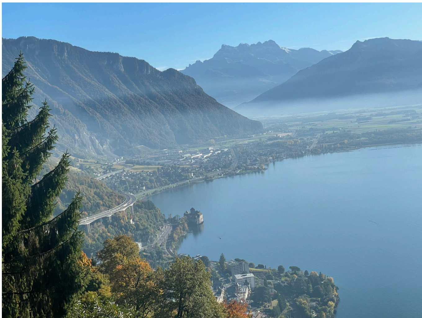
Вид из Глиона на Женевское озеро и Шильонский замок.

Захлопнулась дверь, кондуктор по телефону дал сигнал своему коллеге, и вагон, дернувшись, поехал вверх, к крохотному пятнышку, черневшему на изумрудной вершине. Скоро крыши Монтре остались внизу и перед пассажирами стала разворачиваться круговая панорама Во, Вале, Швейцарской Савойи и Женевы. Здесь, в центре озера, пронизанного студеным течением Роны, находился самый центр западного мира. По озеру, затерянные в бесплотности этой холодной красоты, плыли лодки, похожие на лебедей, и лебеди, похожие на лодки. День был солнечный, ярко зеленела трава на берегу, ярко белели теннисные корты курзала. Фигуры на кортах не отбрасывали тени».