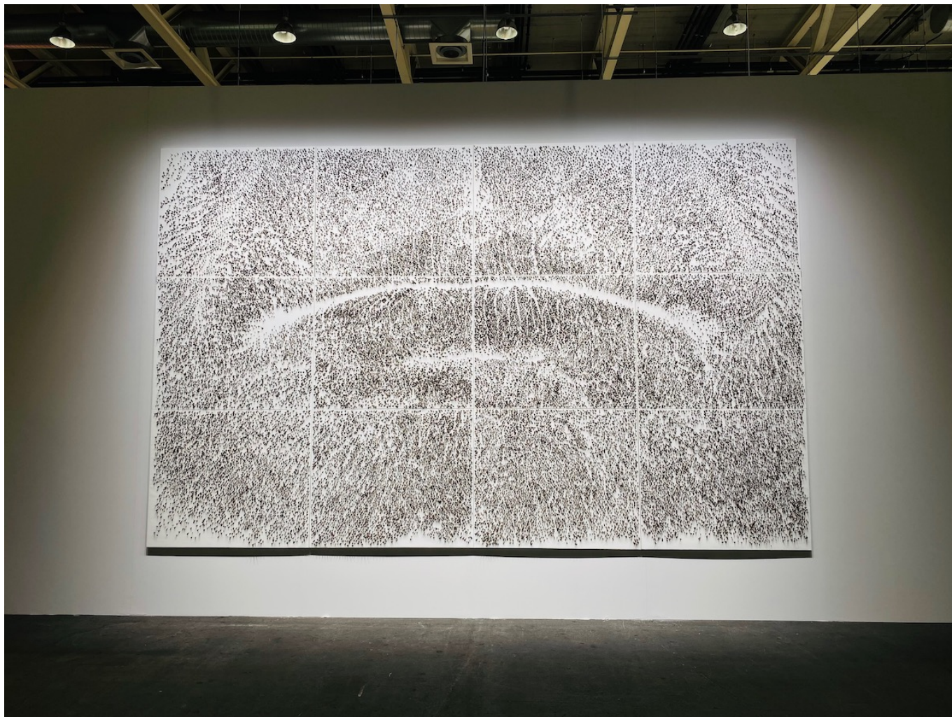
Spine d'acacia—Contatto, aprile 2006, 2006 Giuseppe Penone.