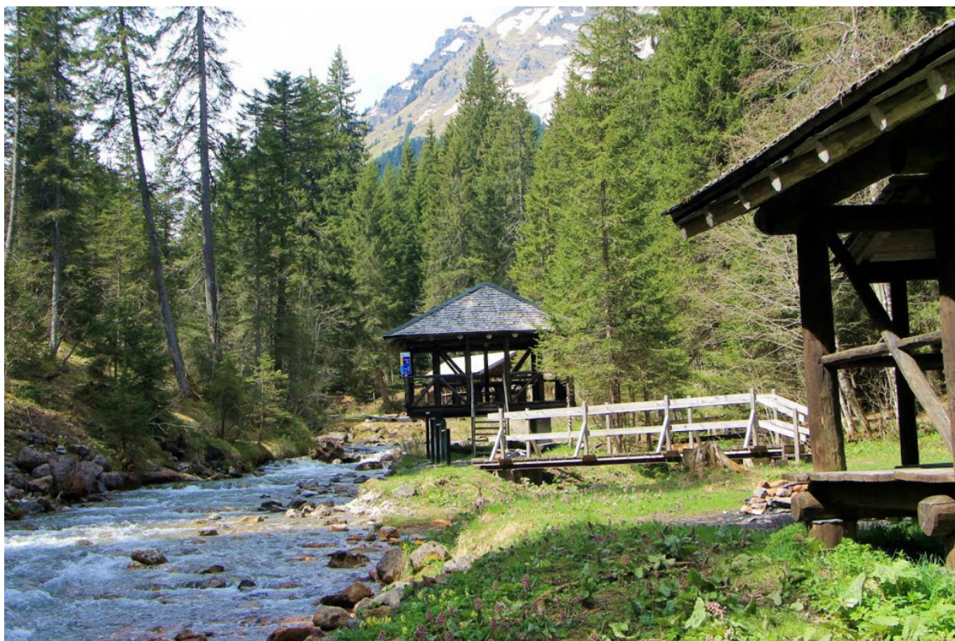
Мельницы Vimoti (DR)

Разумеется, мы не призываем вас превращать субботний день в политическую акцию, но хотим обратить внимание на несколько участвующих в Дне мельниц мест, показавшихся нам особенно интересными.