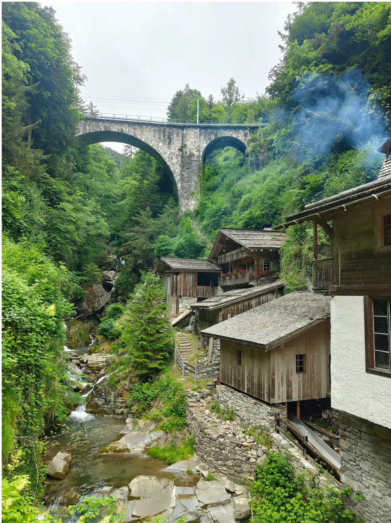
Мельница Veyron

Мельница Veyron будет ждать в субботу посетителей в местечке Chavannes-le-Veyron в кантоне Во. Вы увидите старинное здание, когда-то сдвинутое с изначального места напором воды; отлично сохранившееся лопастное колесо