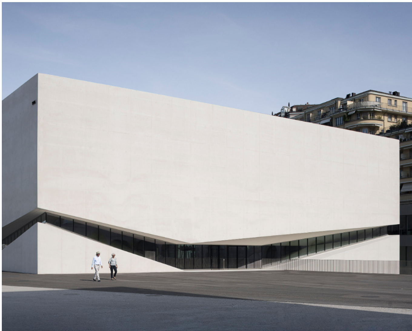
Платформа 10