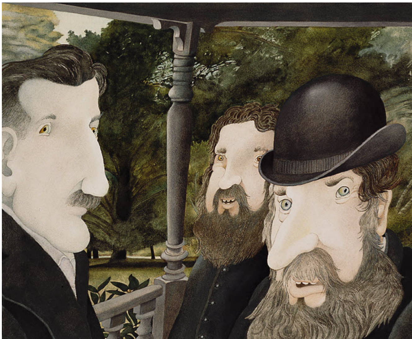
Иллюстрация Этьена Делессера из его книги «La corne de brume», 1990 © Etienne Delessert

живописью и созданием анимационных фильмов. С 1967 года он проиллюстрировал более 80 книг, которые были переведены на 14 языков и пользовались успехом во всем мире. Кроме того, он сам написал 27 книг. Этьен Делессер получил международное признание и как карикатурист, работая для журналов The Atlantic, The New York Times, Facts, Le Monde, Siné Hebdo и других. «Делессер открывает красоту, прекрасное проявление существ и вещей в цвете и через цвет», - писал о нем французский драматург румынского происхождения Эжен Ионеско. О своем творчестве сам Этьен Делессер говорит так: «Я пишу рисунки и рисую идеи». Соединив в одной парадоксальной фразе писательство и рисование, ему удалось передать суть дизайна, как его определяет французский словарь Larousse – «дисциплина, направленная на гармонизацию окружающей человека среды».