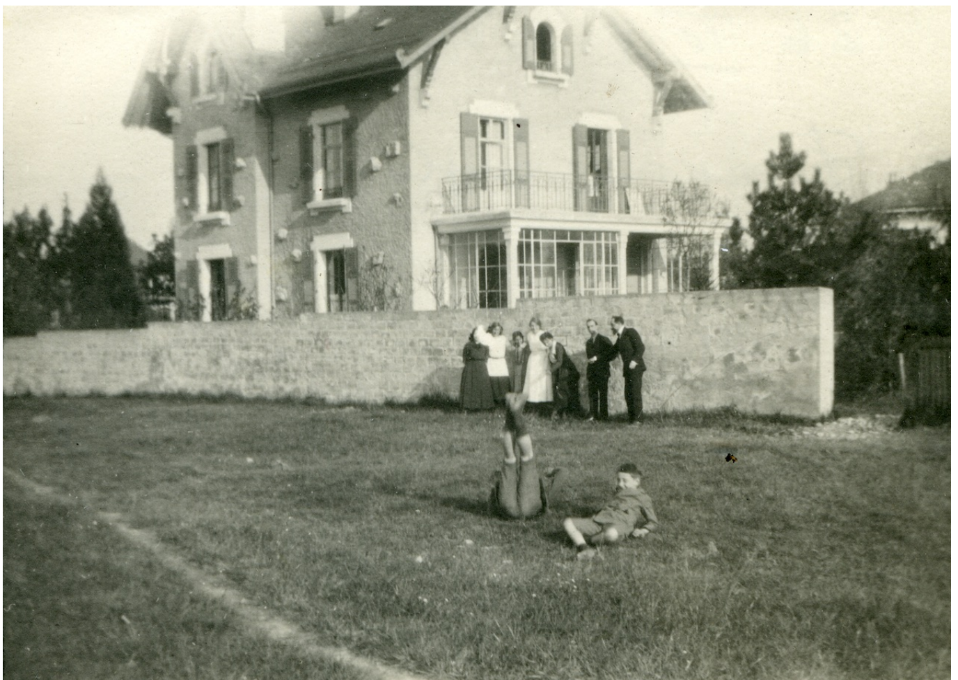
Дом в Коппе, где жил Лев Шестов с семьей. 1910-е гг.

Author: Наталья Громова, Коппе , 11.01.2023.