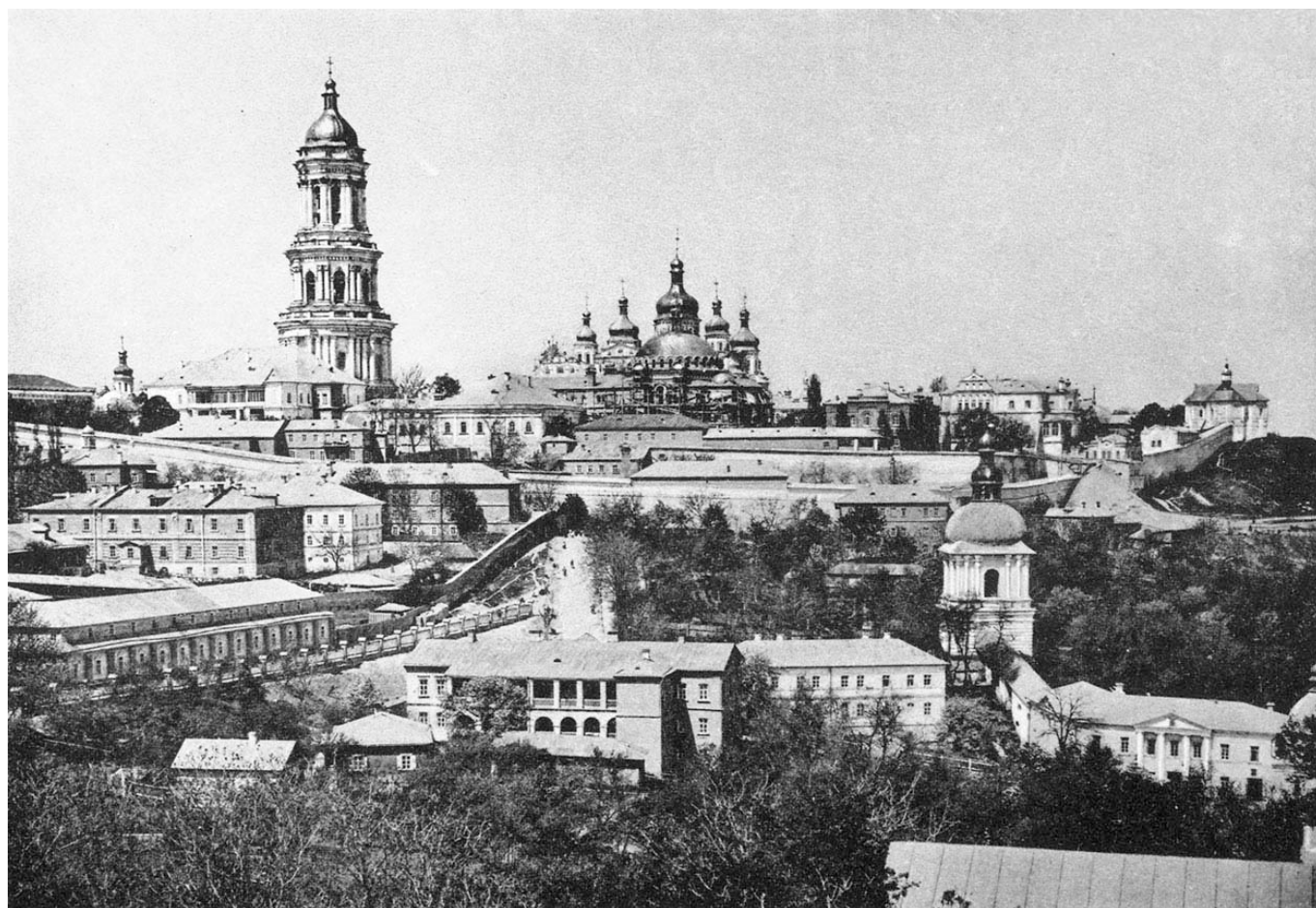
Панорама Киево-Печерской Лавры