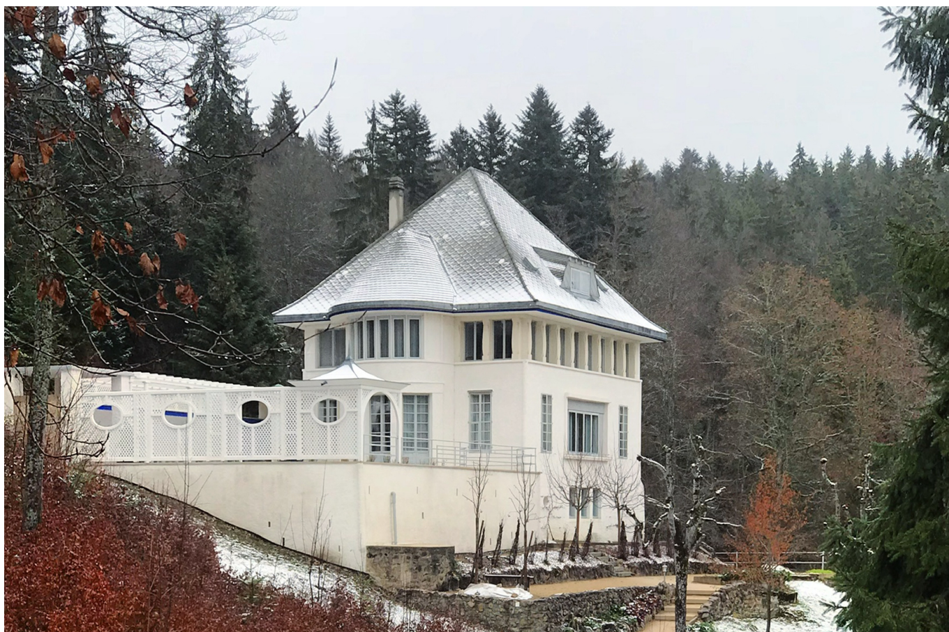
La Maison Blanche - Белый дом Ле Корбюзье

Author: Леонид Слонимский, Ла Шо-де-Фон , 04.11.2022.