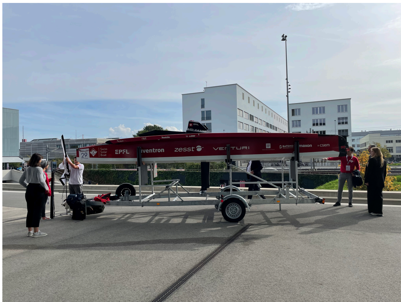
Летающий корабль студентов EPFL

В ответ на это директор Энергетического центра EPFL Ясмينا Калисеси не смогла удержаться от ехидного замечания о том, что «ученые давно предупреждали», и что волшебных решений предложить сейчас невозможно – всем нужно сознательно экономить энергию настолько это возможно.