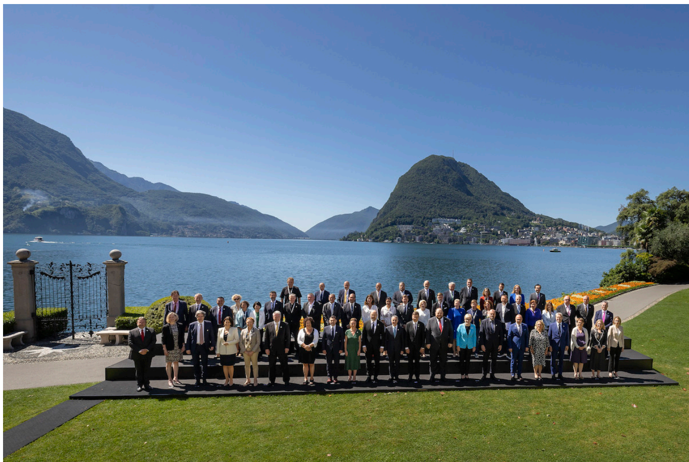
Участники саммита в Лугано.

Author: Заррина Салимова, Лугано , 06.07.2022.