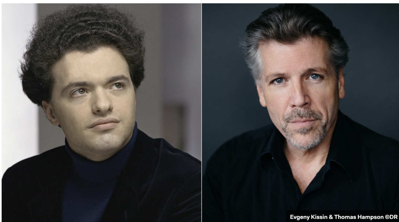
Евгений Кисин и Томас Хэмпсон

Пианист Даниил Трифонов даст сольный концерт из произведений Шимановского, Дебюсси, Прокофьева и Брамса в главном фестивальном шатре 21 июля, где следующим вечером Евгений Кисин и Андраш Шифф исполнят программу, которую некоторые из вас, возможно, услышат в Женеве уже 4 июля. Обращаем ваше внимание на то, что 18 июля Евгений Кисин выступит в Вербье в менее привычном для него амплуа актера-чтеца: вместе с прекрасным баритоном Томасом Хэмпсоном он прочитает «по ролям» написанный в 1938 году рассказ Катрин Крессман Тэйлор «Адресат выбыл», в центре которого – переписка еврейского арт-дилера из Сан-Франциско с его партнером, вернувшимся в Германию в 1932 году.