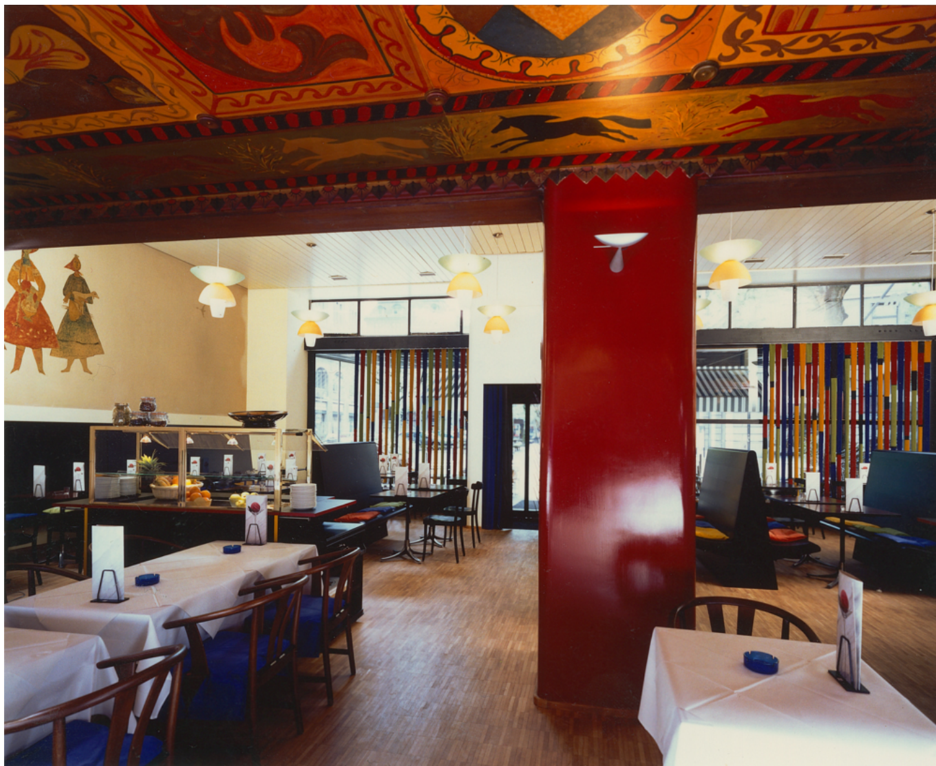
Дизайн интерьера ресторана «Тройка» в Цюрихе, 1997 год

Author: Заррина Салимова, Берн , 05.05.2022.