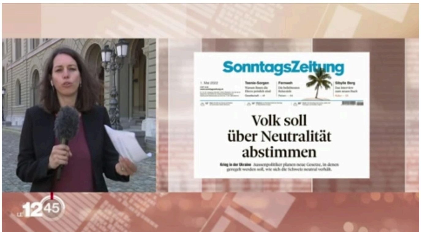
Кадр из передачи с обсуждением нейтралитета

При этом, уже на прошлой неделе председатель партии Центра Герхард Пфистер пошел еще дальше в том же направлении, сравнив отказ от отправки боеприпасов с «непомощью» Украине.