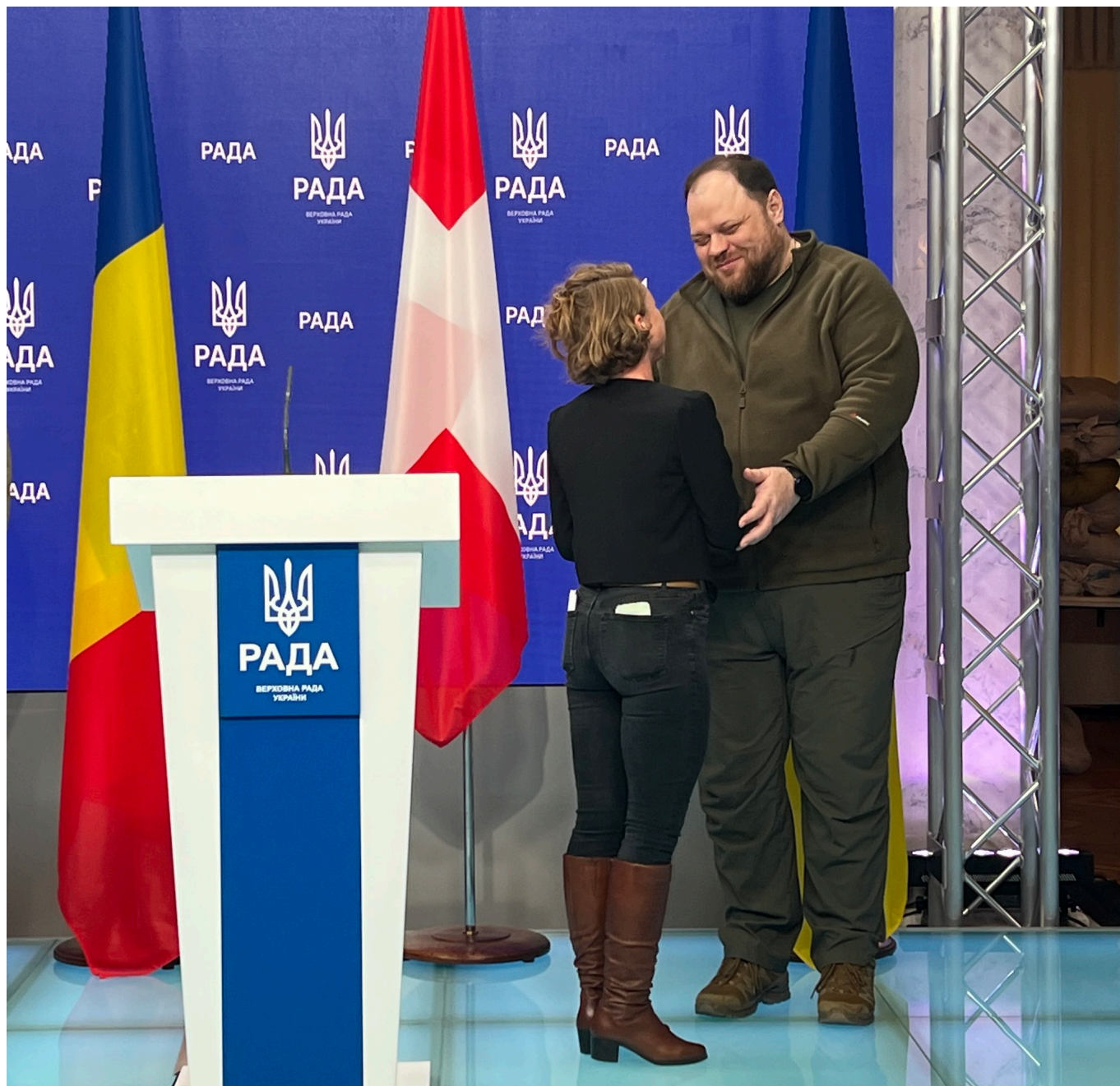
Так и хочется назвать эту фотографию "Руслан и Ирен(а)"

Отвечая на критику, он заявил, что подобные визиты не противоречат юридической сути швейцарского нейтралитета. «То, чем мы занимаемся здесь, это и есть политика нейтралитета. Для такой страны, как Швейцария, самое главное – это соблюдение международного права. А вторжение на территорию соседа – это грубейшее его нарушение», - напомнил он. Пользуясь случаем, он назвал предложение председателя Партии центра Герхарда Пфистера поставлять боеприпасы Украине (о котором НГ писала ) «абсурдным», поскольку в этом случае, следуя принципу нейтралитета, Швейцария была бы обязана поставлять оружие и России.