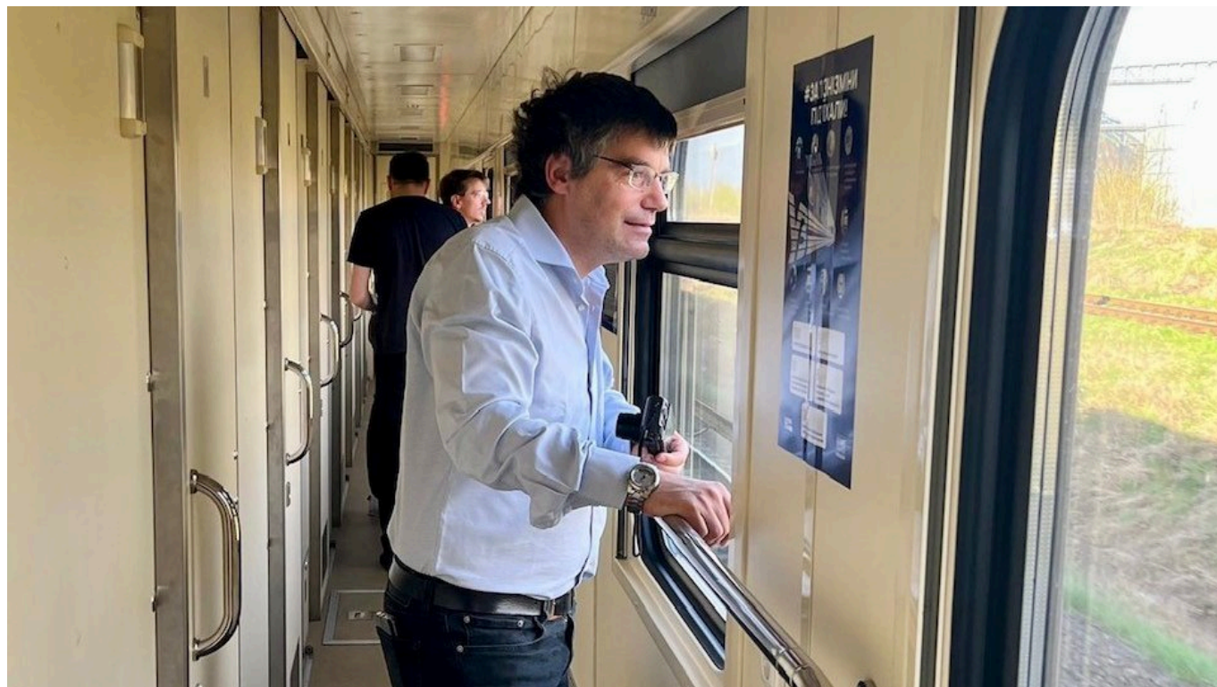
Роже Нордманн на пути в Киев

В тот же день парламентарии побывали также в Гостомеле, который г-н Нордманн описал как «кладбище каркасов танков». Он отметил, ни с какими конкретными просьбами украинские коллеги к ним не обращались, и подчеркнул, что от войны страдает не только мирное население Украины, но и ее политические лидеры, которым каждый день приходится принимать крайне сложные решения. При этом он четко заявил, что аналогичный парламентский визит в российскую Думу сейчас невозможен.