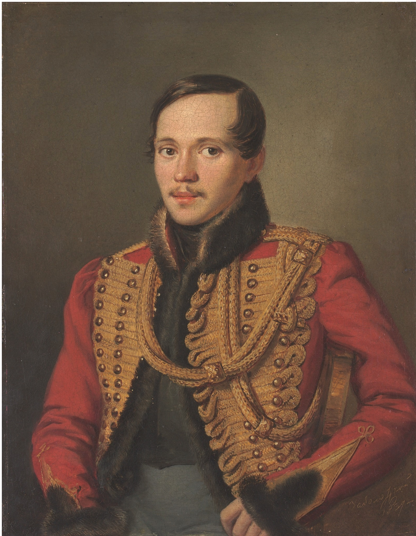
П. Е. Заболотский. М. Ю. Лермонтов в ментике лейб-гвардии Гусарского полка (1837 г.)

У Вашей книги есть подзаголовок - «Жизнь и смерть четырех оппозиционеров». При этом героев повествования не четыре, а десятки! Кому адресовано это сочинение, содержащее сотни имен, подчас малоизвестных, а