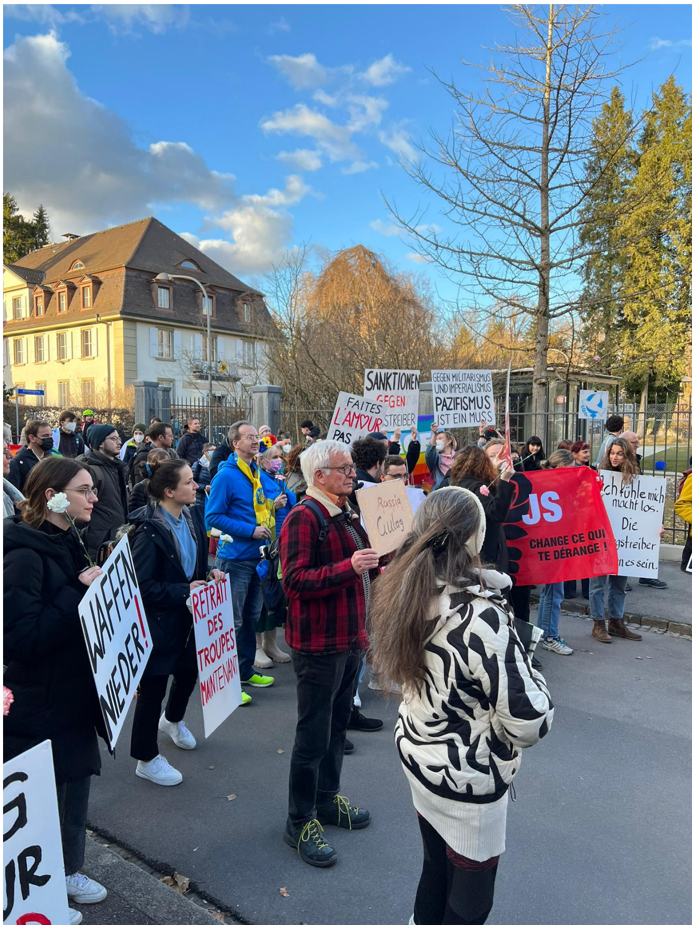
Митинг перед посольством Российской Федерации в Берне 23 февраля 2022 г.

В опубликованном в конце рабочего дня коммюнике общественности было сообщено, что швейцарские власти находятся в постоянном контакте с другими странами,