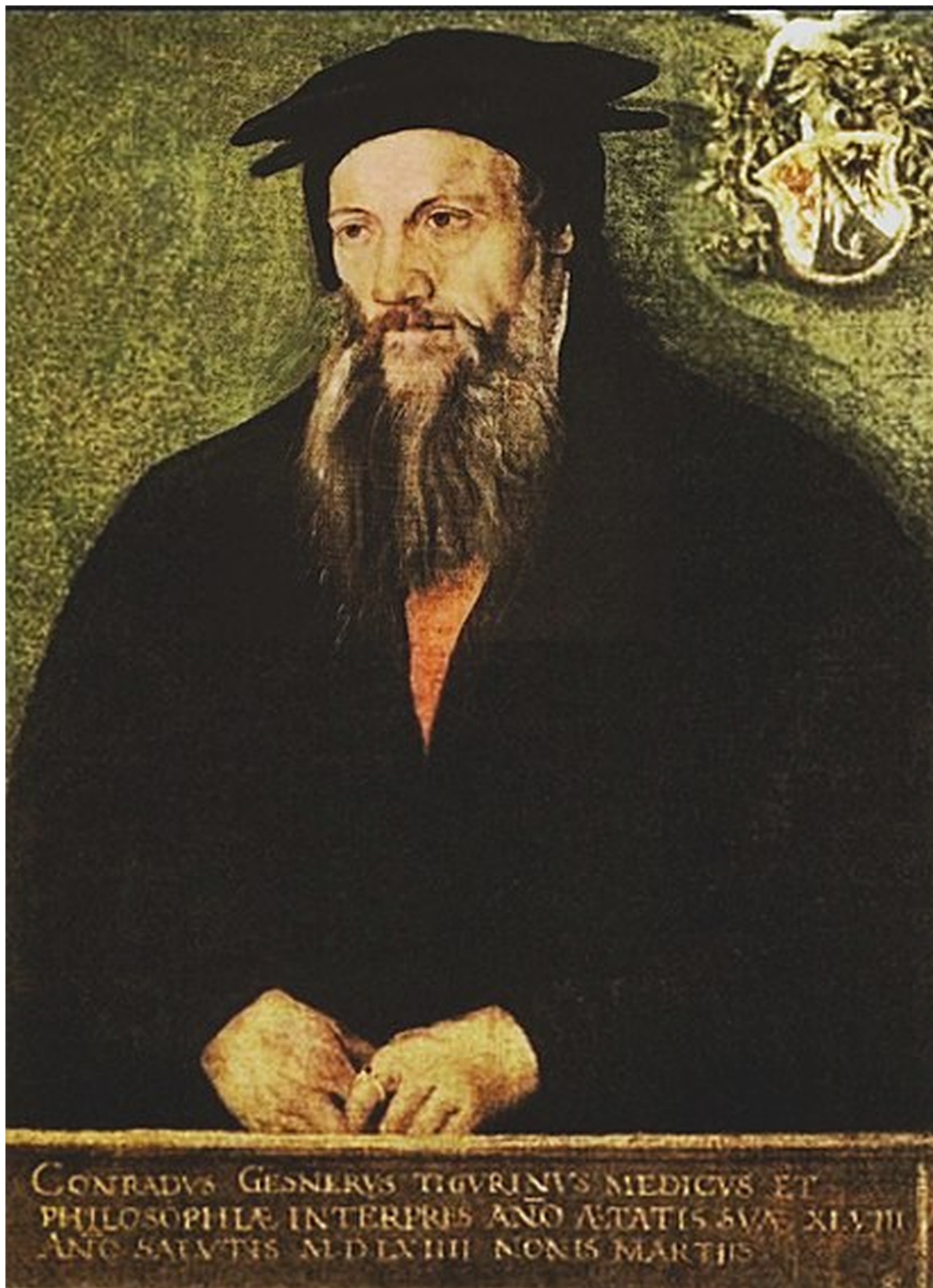
Тобиас Стиммер. Портрет Конрада Гесснера, 1564 г.

Стоит ли удивляться, что местные жители боялись не только подниматься на гору, но