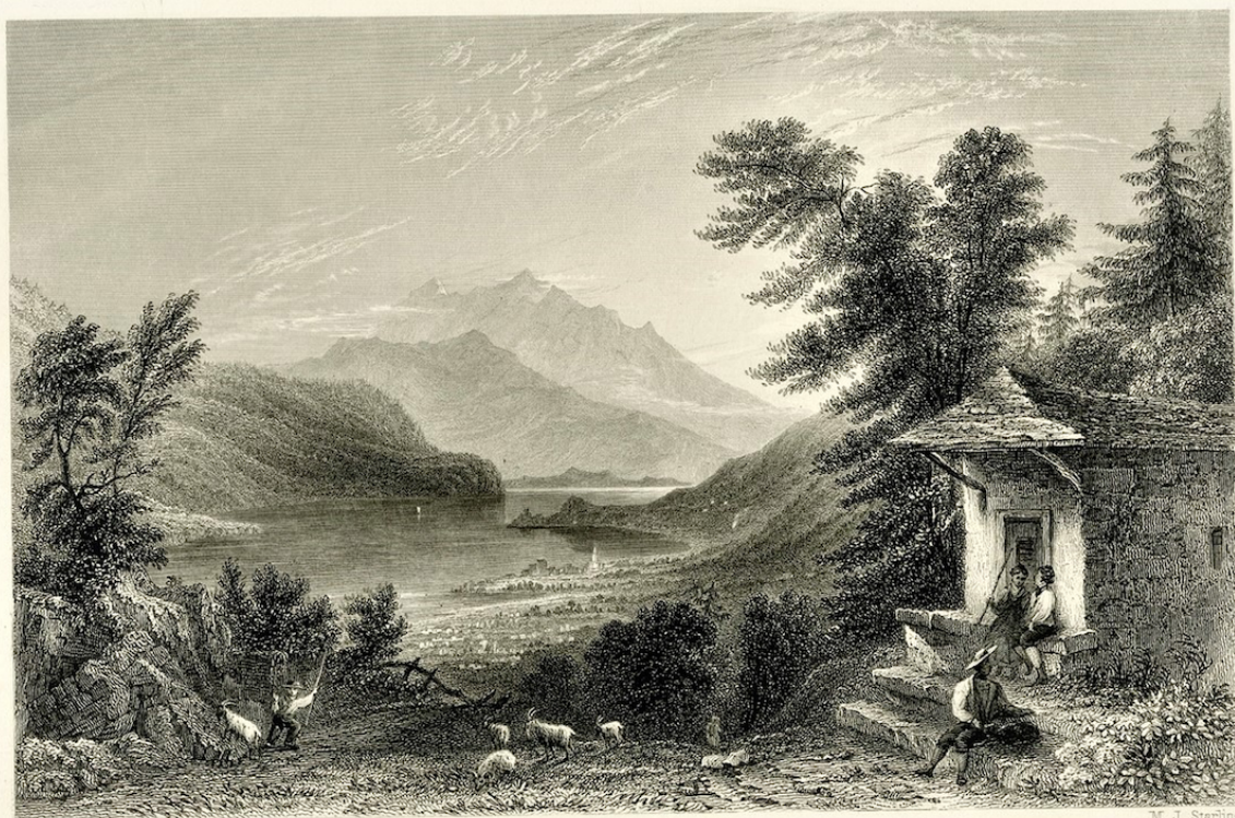
MOUNT PILATUS, — FROM THE BRUNIG.

Author: Наталья Беглова, Люцерн , 04.02.2022.