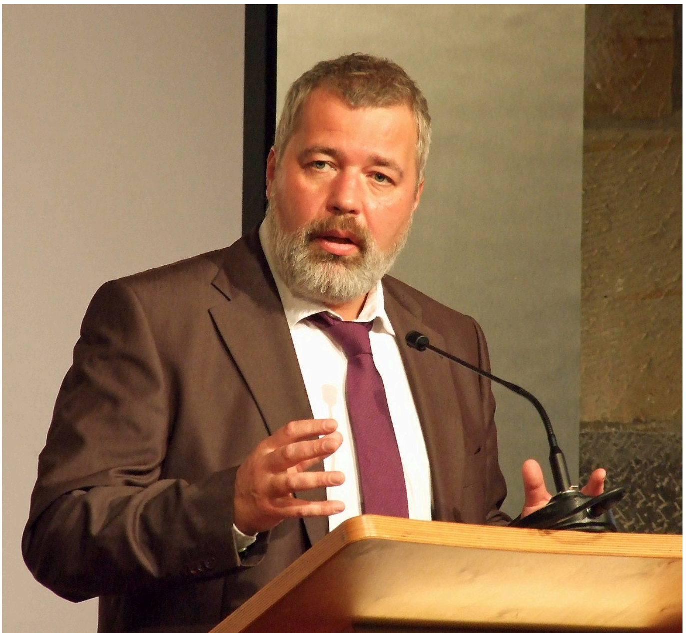
Дмитрий Муратов