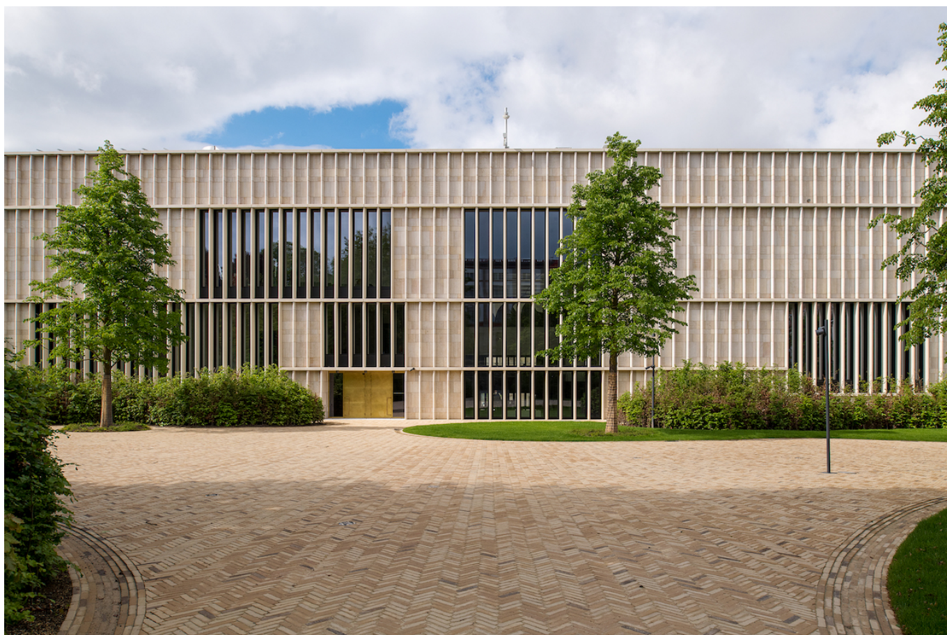
Сад у здания Чипперфильда.

20 лет – ровно столько времени понадобилось, чтобы воплотить в жизнь идею расширения Кунстхауса . Впервые над этим вопросом задумались в 2001 году, а конкурс на лучший архитектурный проект был проведен в 2008-м. Потом состоялся референдум, на котором цюрихцы одобрили выделение кредита на строительство, и, наконец, в 2015-м началось возведение здания по проекту знаменитого британского архитектора Дэвида Чипперфильда. Новый музейный корпус был завершен зимой 2020 года, а его «пробное» открытие состоялось этой весной буквально под «аккомпанемент» звуковой инсталляции Уильяма Форсайта, о чем Наша Газета подробно рассказывала . Чтобы поблагодарить общественность за поддержку и то, что ровно девять лет назад жители города сказали «да» расширению Кунстхауса на референдуме, музей устраивает день открытых дверей: в эти выходные, 9 и 10 октября, музейные сокровища можно будет увидеть бесплатно с 10.00 до 18.00.