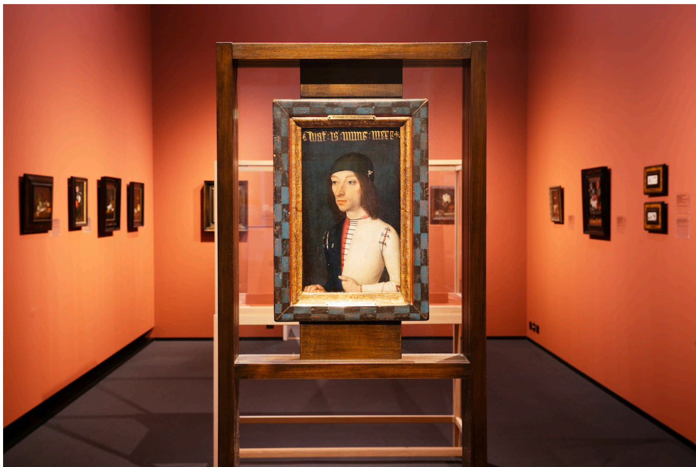
Коллекция Кнехта.

Рисунки, гравюры и фотографии из соображений их сохранности не могут быть выставлены постоянно, но теперь имеют свой собственный зал, где экспонаты будут регулярно меняться. Программа открывается экспозицией, посвященной наследию Леони Тоблер, с виртуозными гравюрами от Дюрера и Рембрандта до Мане и Гогена. Произведения из хрупкой коллекции дадаистов были оцифрованы, а оригиналы представлены в отдельном зале, включая работы Ханны Хёх, Ханса Арпа и других живших в Цюрихе художников, которые внесли свой вклад в развитие авангарда межвоенного периода.