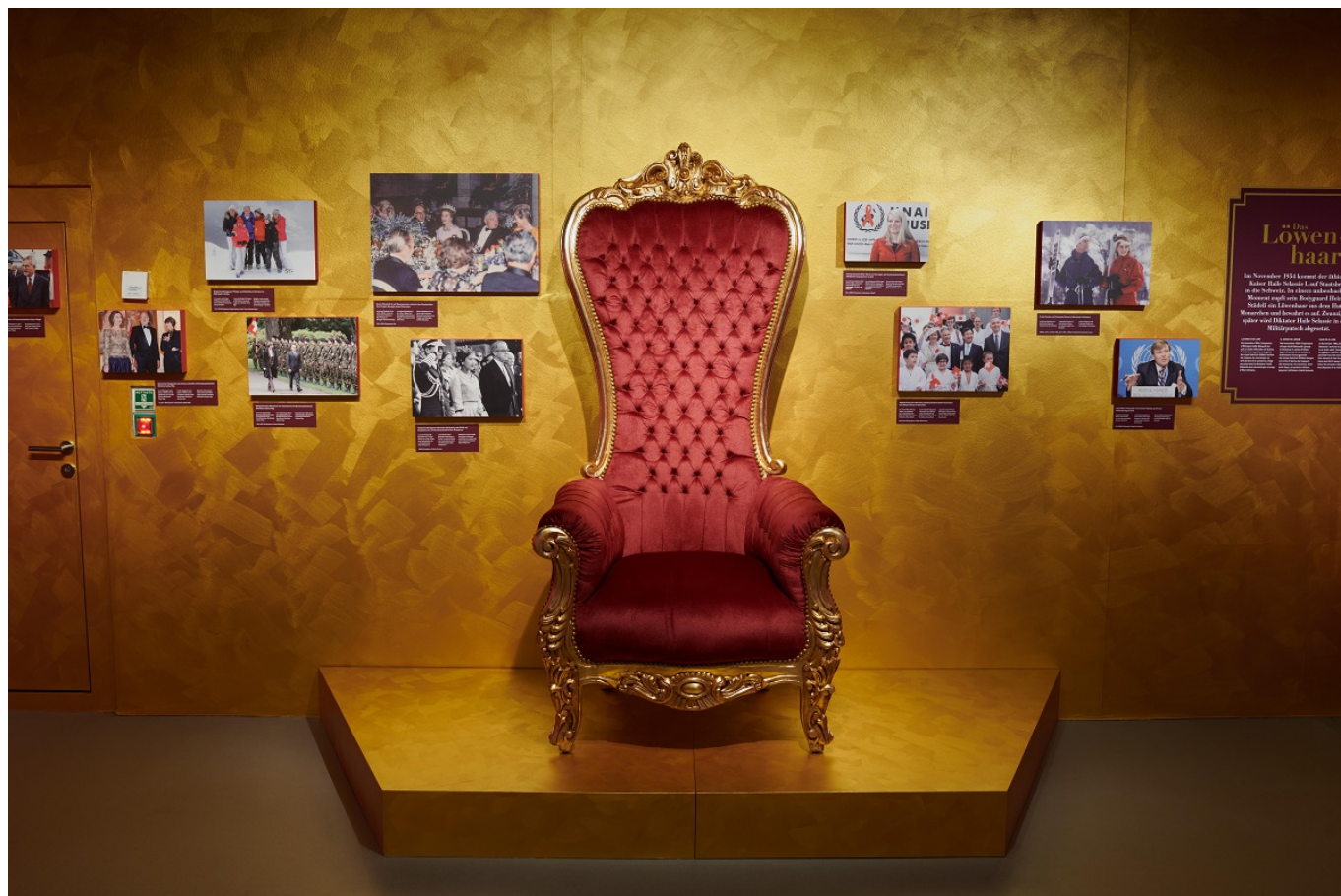
Фото:Musée national suisse