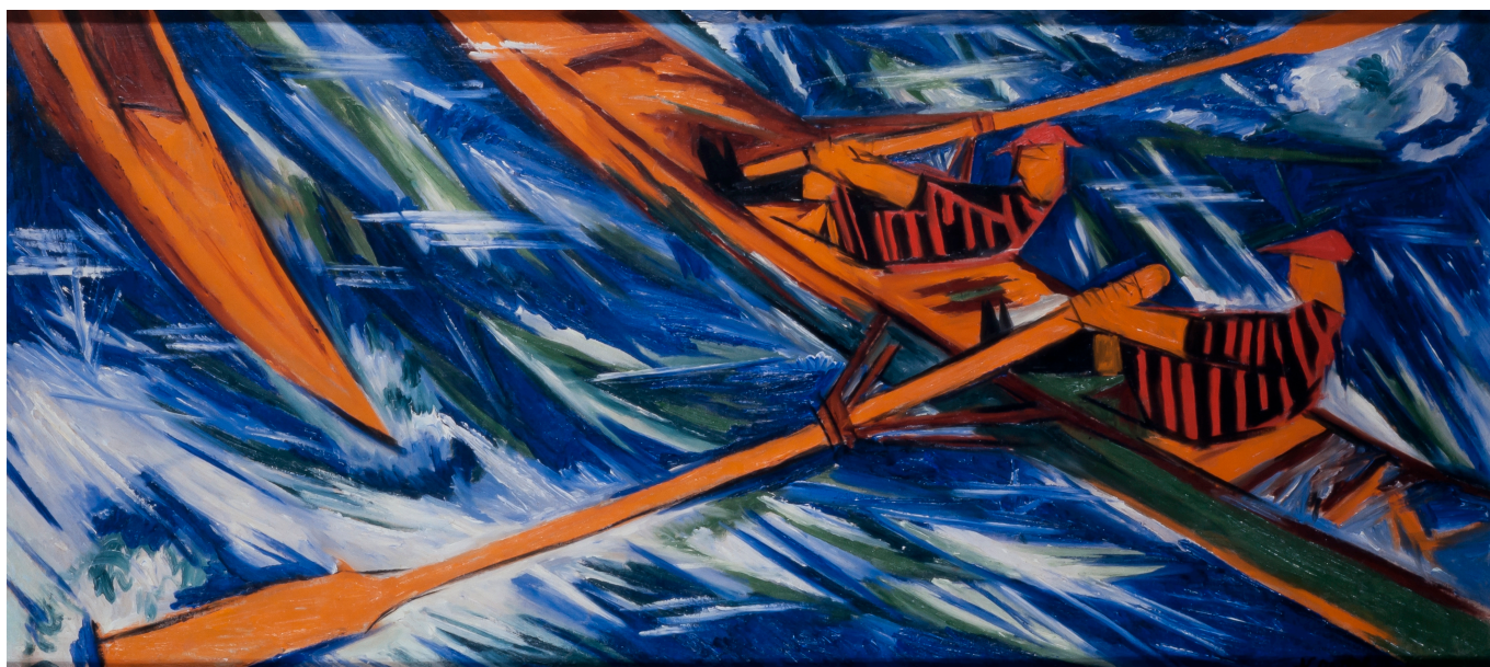
Наталья Гончарова. Гребцы, 1912 г.