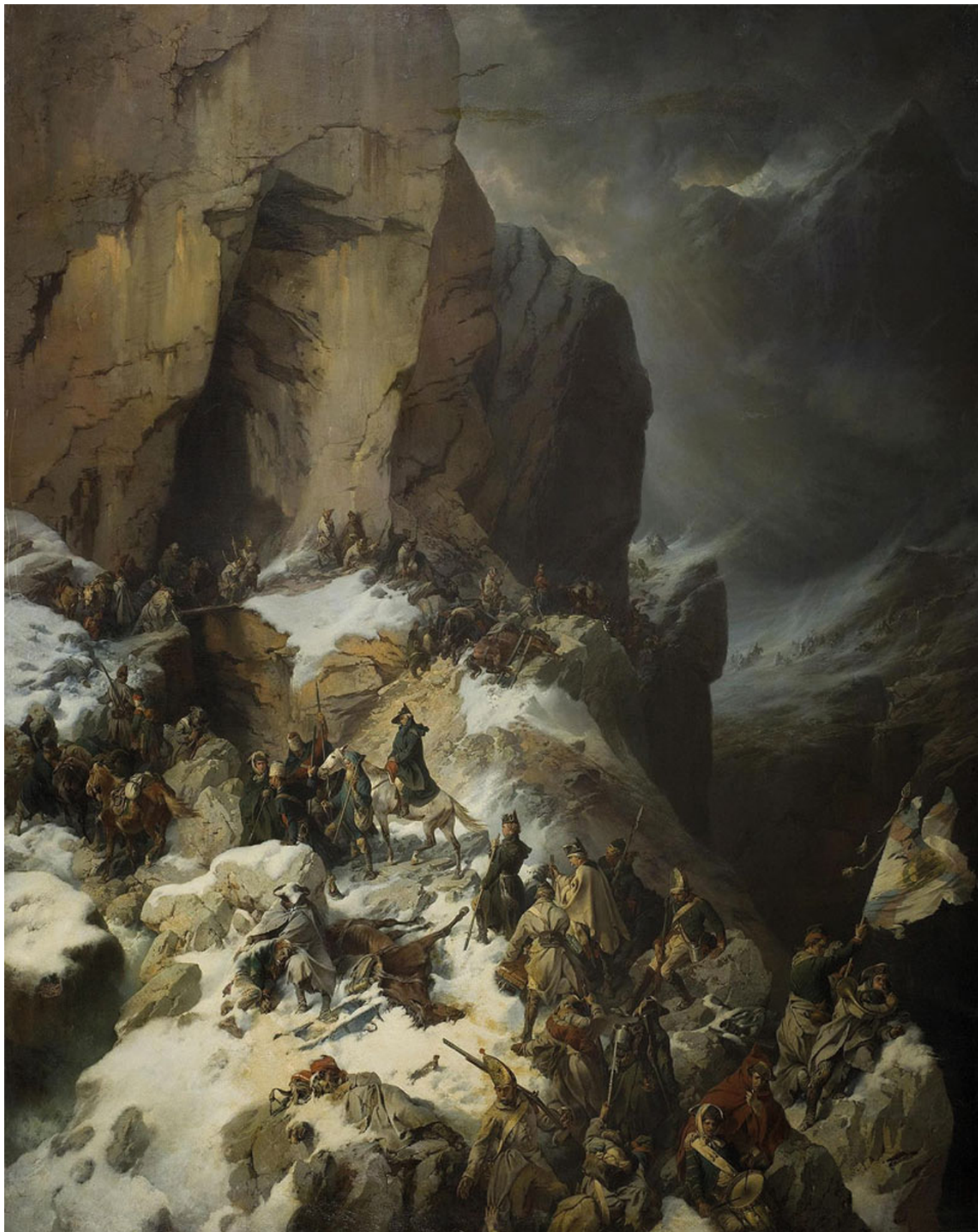
А.Е. Коцебу. Переход Суворова через перевал Паникс в Альпах. 1860 г. Государственный Эрмитаж, Санкт-Петербург

В своём донесении Павлу I Суворов писал: «На каждом шаге в сём царстве ужаса зияющие пропасти представляют отверстые и поглотить готовые гробы смерти, дремучие мрачные ночи, непрерывно ударяющие громы, льющиеся дожди и густой туман облаков при шумных водопадах с камнями с вершин низвергавшихся,