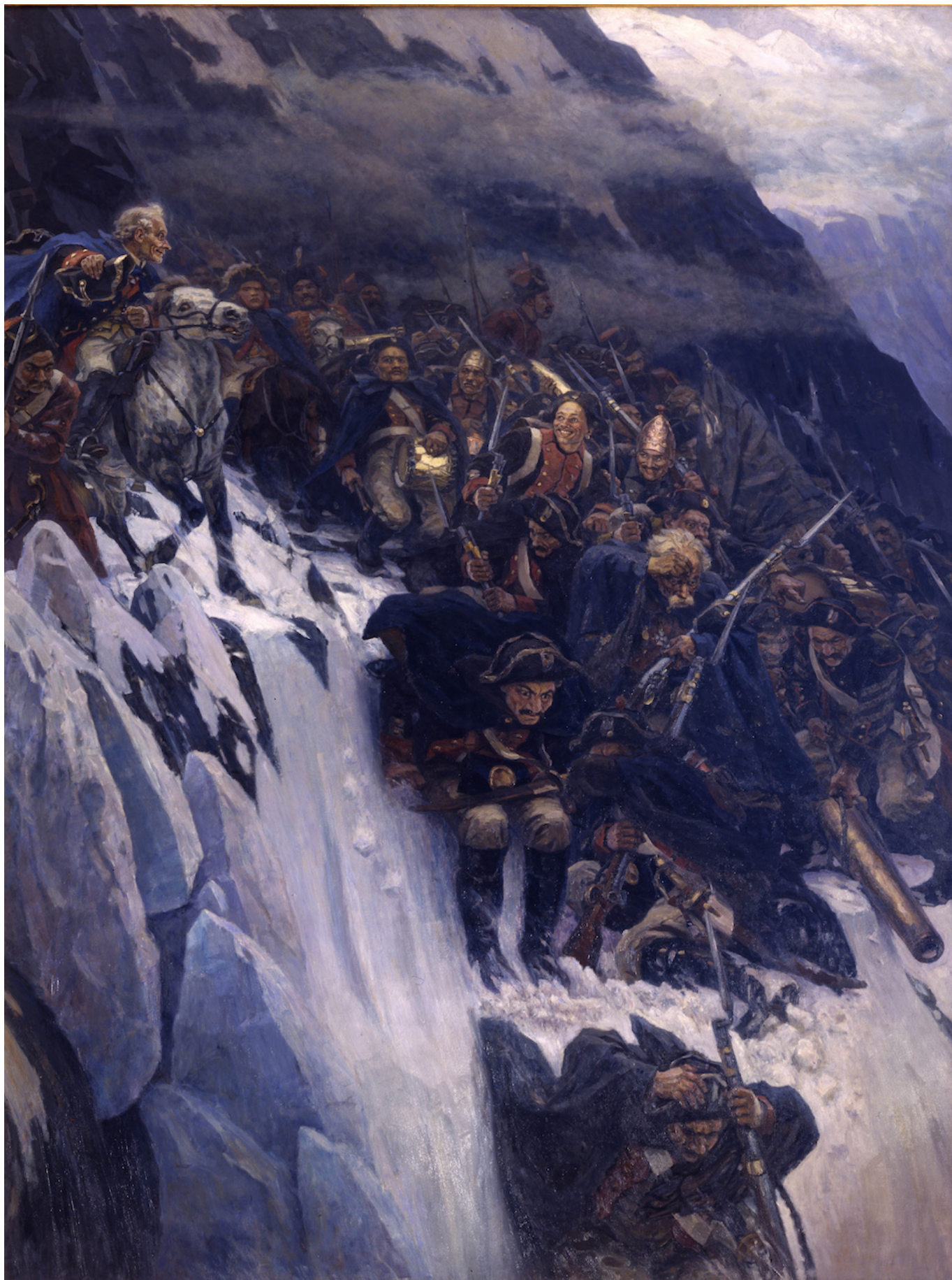
В. И. Суриков. Переход Суворова через Альпы в 1799 году. 1899. Государственный Русский музей, Санкт-Петербург

Суриков действительно задумал свою картину задолго до юбилейной даты. Первый