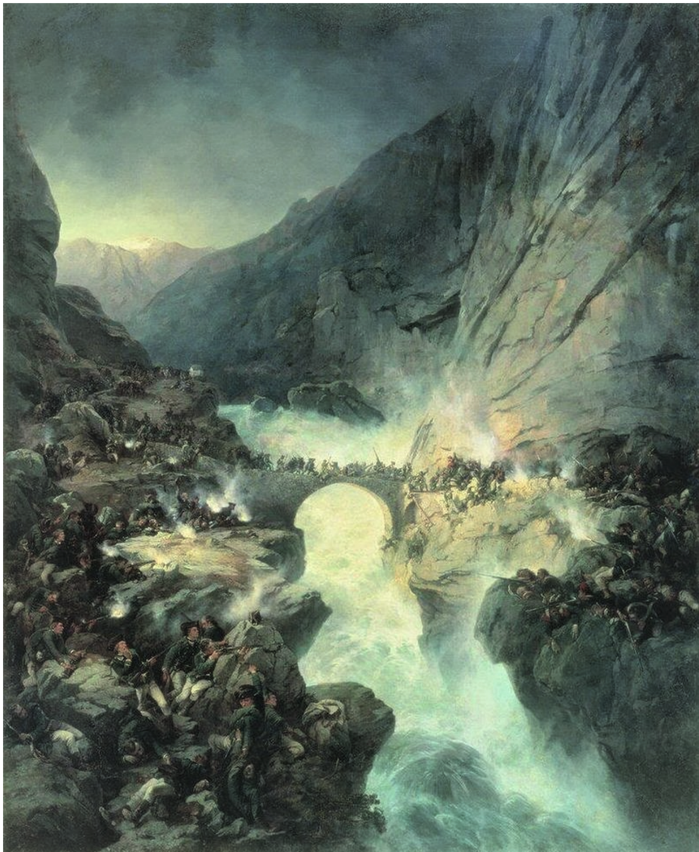
А.Е. Коцебу. Переход русских войск через Чёртов мост в 1799 году. 1857 г. Государственный Эрмитаж, Санкт-Петербург

Действительно: если исходить из того, что Суриков ставил задачу поведать об успехе операции, о героизме солдат, об их беззаветной вере в своего полководца, а не о драматическом развитии событий, тогда всё становится на свои места. Однако есть картина другого российского художника-баталиста, Александра Евстафиевича Коцебу (1815–1889), запечатлевшая ту же сцену, которая, вероятно, лучше передаёт то, что на самом деле происходило тогда в Альпах.