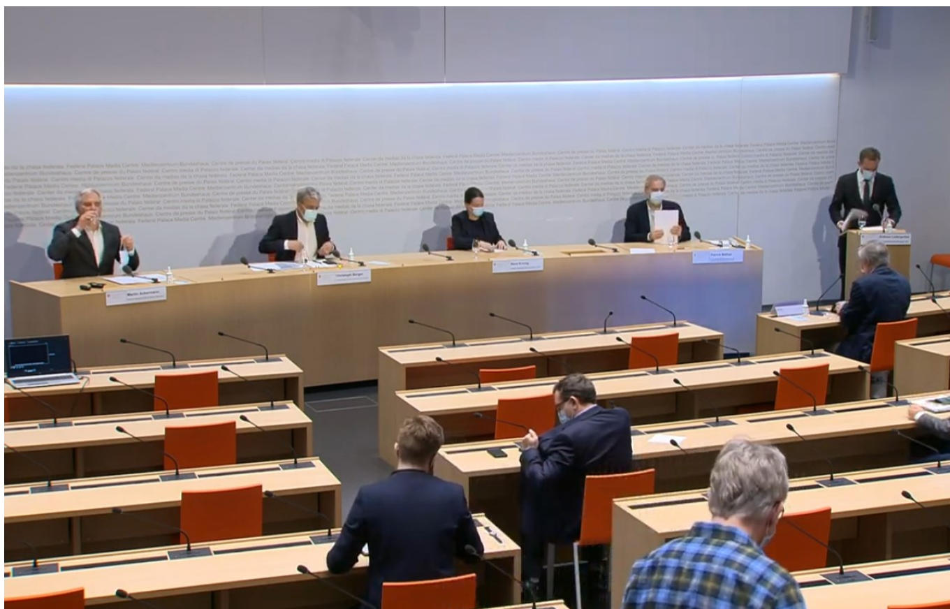
Скриншот брифинга от 26 января

Author: Заррина Салимова, Берн , 27.01.2021.