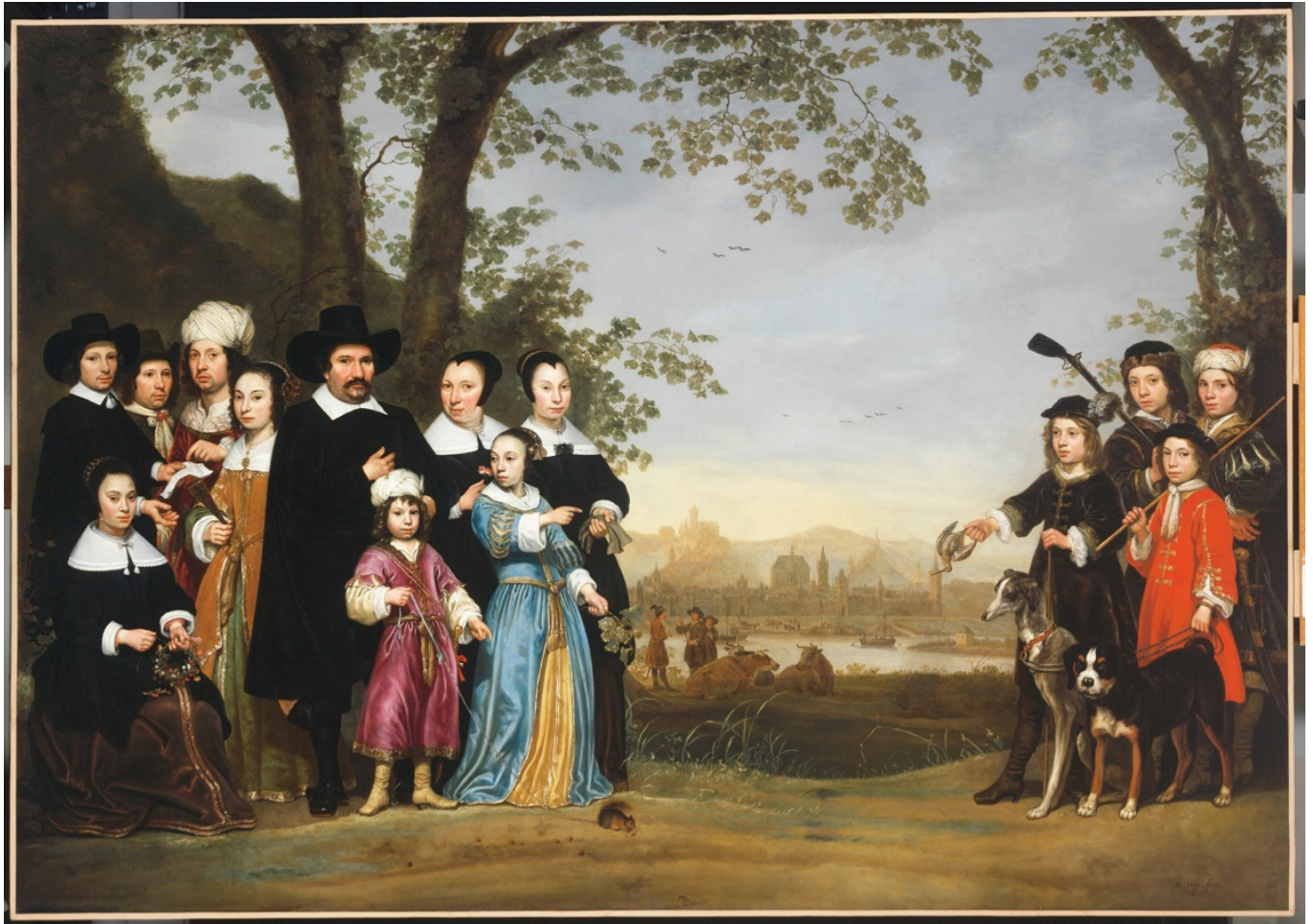
«Gruppenbildnis der Familie Sam», Aelbert Cuyp, um 1653

Россией, странами Балтики, Средиземноморья и Ближнего Востока.