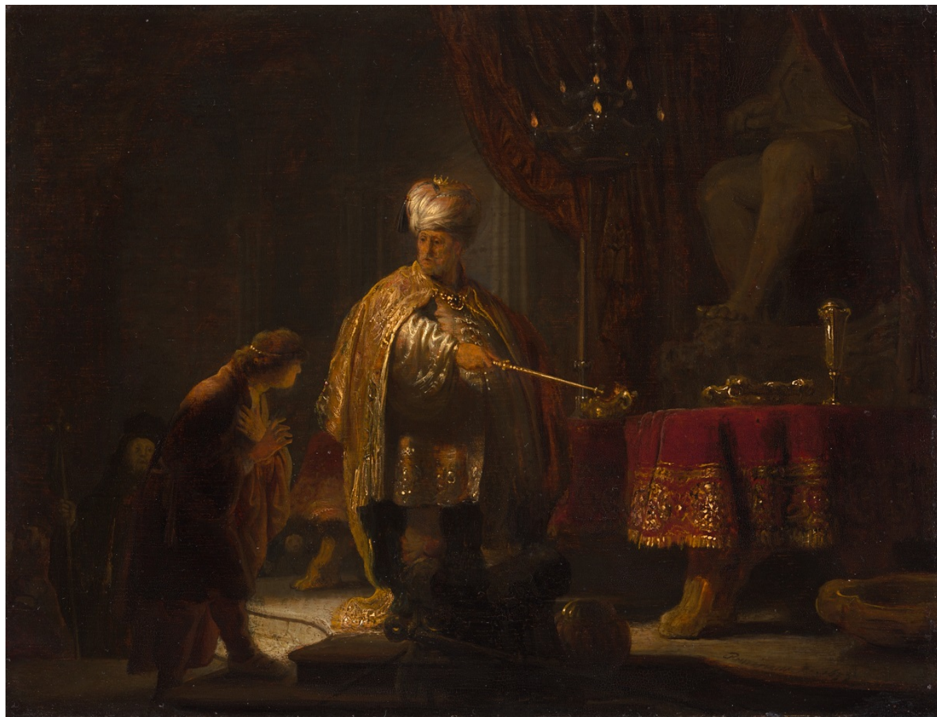
«Daniel und Cyrus vor dem Götzenbild des Bel», Rembrandt Harmensz van Rijn, 1633

Если в Романдии из-за противоэпидемических ограничений культурная и социальная жизнь поставлены на паузу, то в некоторых немецкоязычных кантонах Конфедерации музеи (пока) открыты. В Кунстмузеуме Базеля, например, сейчас проходит одна из главных выставок сезона – «Восток Рембрандта».