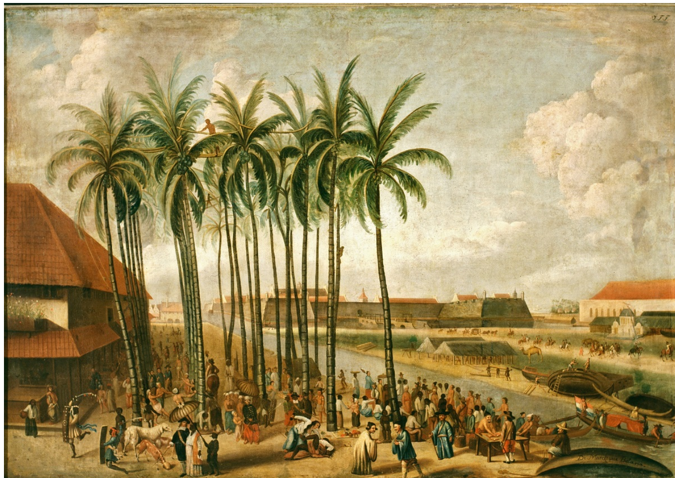
«Der Markt von Batavia», J. F. F. nach Andries Beeckman, nach 1688 (c) Tropenmuseum, Amsterdam, Collection Nationaal Museum van Wereldculturen. Coll.no. TM-118-167

Истины в этих полотнах, на самом деле, не так и много. Живописные изображения, посвященные, например, теме торговли, по большей части не были ни реалистичными, ни документальными. Художники не претендовали на то, чтобы точно изобразить повседневную сцену или историческое событие, а некоторые отличались «потребительским» отношением и поверхностным подходом, ограничиваясь заимствованием понравившихся экзотических вещей, например, расшитых халатов, мягких туфель с кисточками или посуды, и их интеграцией в повседневную жизнь. Библейские сцены со скалами, пальмами, мужчинами в тюрбанах и женщинами в ярких одеждах и вовсе основаны на фантазиях, так как очень немногие голландцы сами видели эти места и имели представление о тех реалиях. Восток для них был абстрактной идеей и чем-то противоположным рационалистическому Западу. В целом, многие картины только укрепляли существовавшие тогда клише, но, тем не менее, живописцы, противопоставляя привычную им среду Востоку, внесли большой вклад в возникновение и определение понятия европейской идентичности.