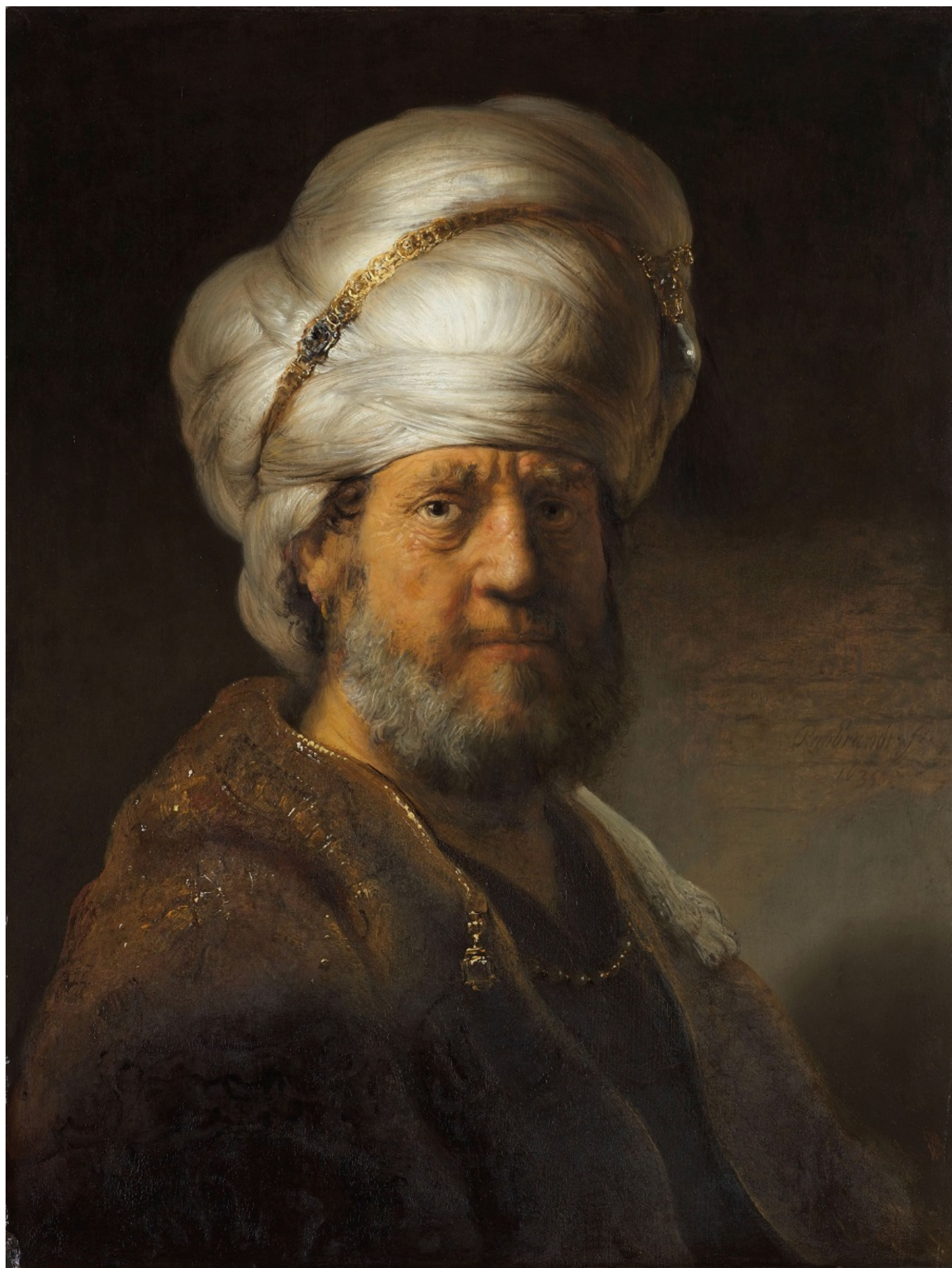
«Brustbild eines Mannes in orientalischer Kleidung», Rembrandt Harmensz van Rijn, 1635 (c) Rijksmuseum Amsterdam, Schenkung Herr und Frau Kessler-Hülsmann, Kapelle-op-den-Bos

покупал японскую бумагу, которую использовал для своих гравюр.